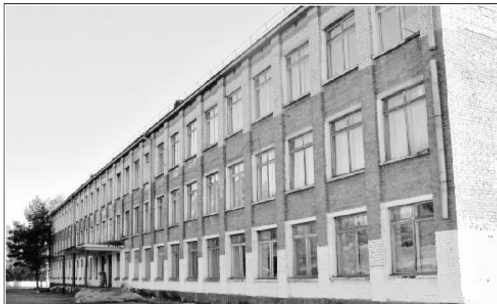
Самой большой школе района БСОШ №1 требуется капитальный ремонт.

Денежные средства на образование поступают поздно, но многие школы уже сделали косметический ремонт. Отметим в этом плане Нижнемангиртуйскую, Сухоручьевскую, Старобичурскую, Дабатуйскую начальные школы. Предписания они выполняют, ремонт сделан очень аккуратно. Требуется капитального и текущего ремонта, новой мебели и оборудования БСОШ №1 и Билютайская общеобразовательная школа. В Толкинской основной школе – привозная вода и не соответствует санитарным правилам пищеблок. Окино-ключевская базовая школа находится в типовом здании и должна быть образцовой. Сегодня здесь идет ремонт спортивного зала, полов, требуют замены оконные рамы, запланировано оборудование теплых туалетов. Нижнемангиртуйская начальная школа подготовлена хорошо, а в Верхнемангиртуйской готовятся к большому ремонту отопительной системы. В Хаянской начальной школе готов пока один кабинет, также много еще работы предстоит в Еланской школе, в том числе ремонт протекающей кровли. Киретская и Покровская школы частично готовы, а Сухоручьевская, хоть сегодня готова принять учеников. Гочитская школа не принята, много несоответствий по линии Роспотребнадзора. С душой относятся к обустройству в Шибертуйской школе, здесь запланировано строительство новой котельной. Старательно готовят Шанагинскую начальную школу, но еще нужно провести работу по озеленению и благоустройству территории. Преобразилась По-