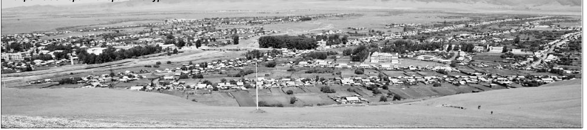
панорама Бичуры.