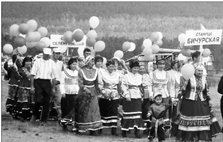
Полосу подготовила Тамара Савельева.

Фестиваль казачьей культуры проводился в Бурятии впервые, и конечно не обошлось без организационных накладок. Но все, в том числе и неудобства палаточного быта, с лихвой компенсировались хорошим урожаем наград, полученных делегацией нашего района.