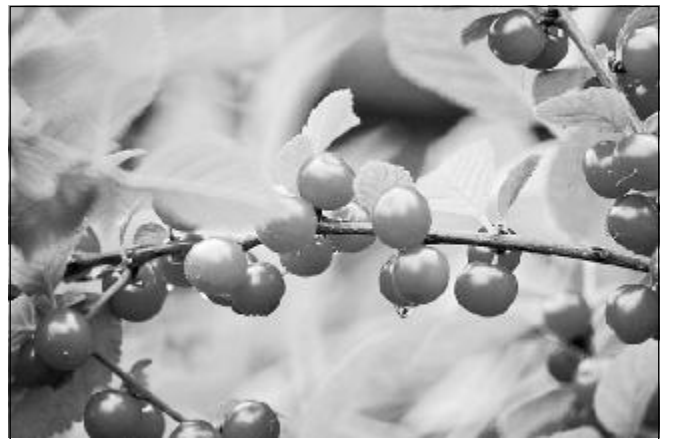
Вишня, омытая дождем.