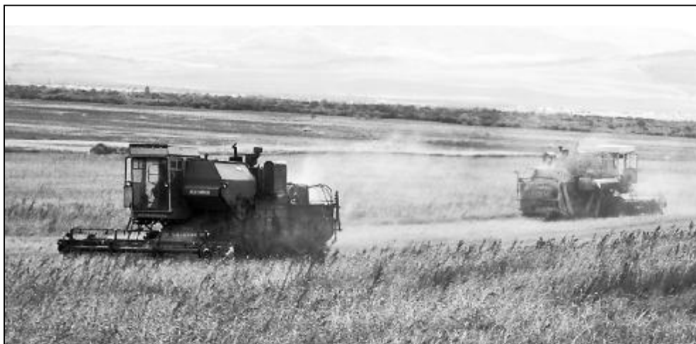
Полосу подготовил Лука Луговской.

Глава райадминистрации В.Г. Калашников призвал руководителей, работников сельского хозяйства поработать во втором полугодии более плодотворно, повысить темпы производства и увеличить выпуск сельскохозяйственной продукции, в то же время снижая ее себестоимость.