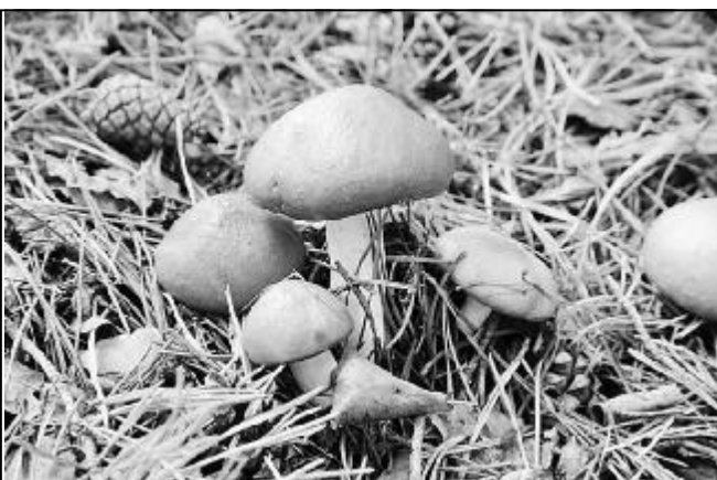
Вот это грибочки!