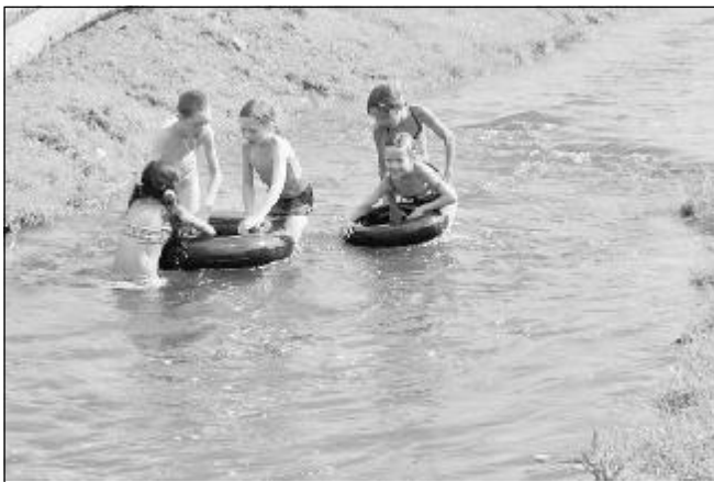
А водичка-то совсем теплая!