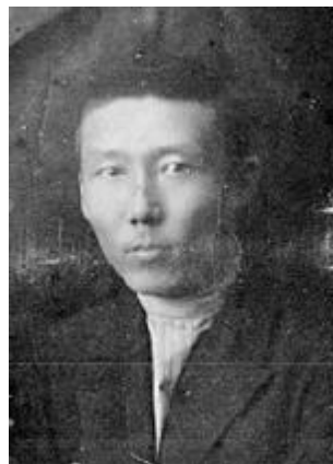
Фото 1938 года.