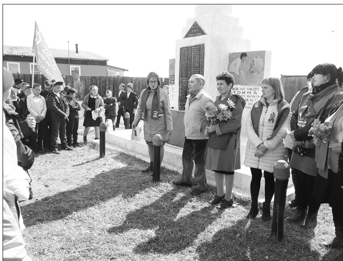
Автопробег ко Дню Победы в с. Буй