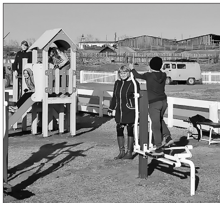
Детская площадка в с. Буй