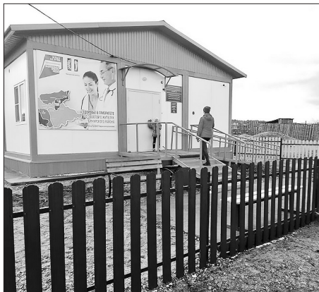
ФАП в с. Узкий Луг