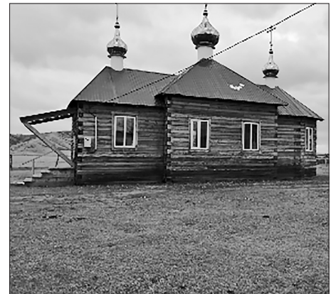
Церковь в с. Узкий Луг