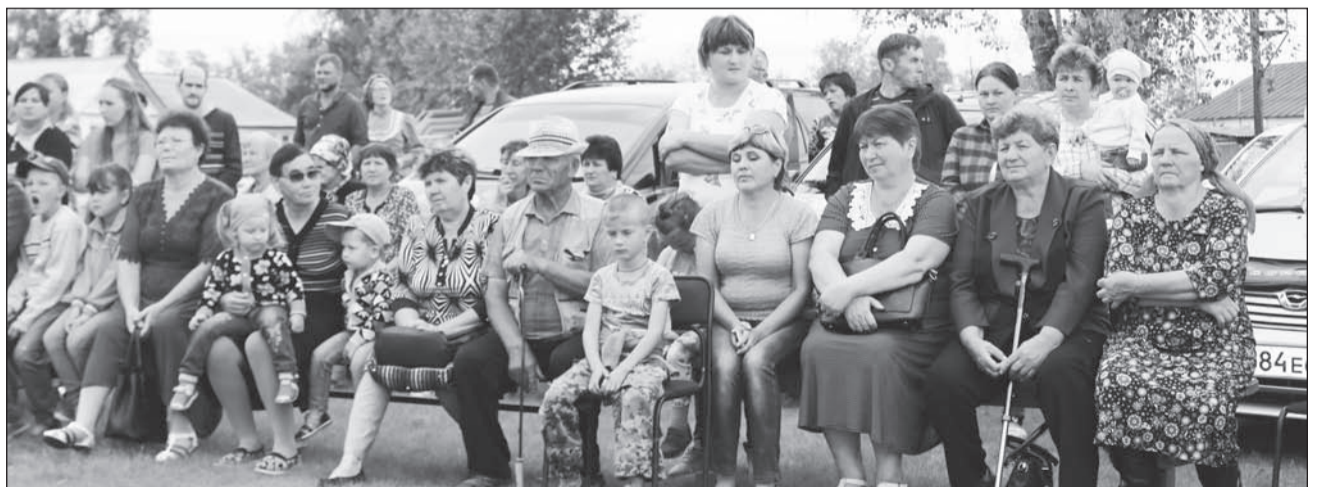
На праздник пришли люди разных возрастов

Несмотря на то, что сегодня у швейной фабрики непростые времена, поселок, названный в честь нее, продолжает жить.