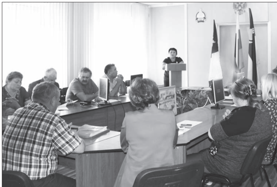
Совещание прошло в формате круглого стола

Развитие животноводства является приоритетной отраслью в развитии сельскохозяйственного производства. По итогам первого полугодия во всех категориях хозяйств содержится КРС — 31 550 голов. Наблюдается рост поголовья в сельхозорганизациях