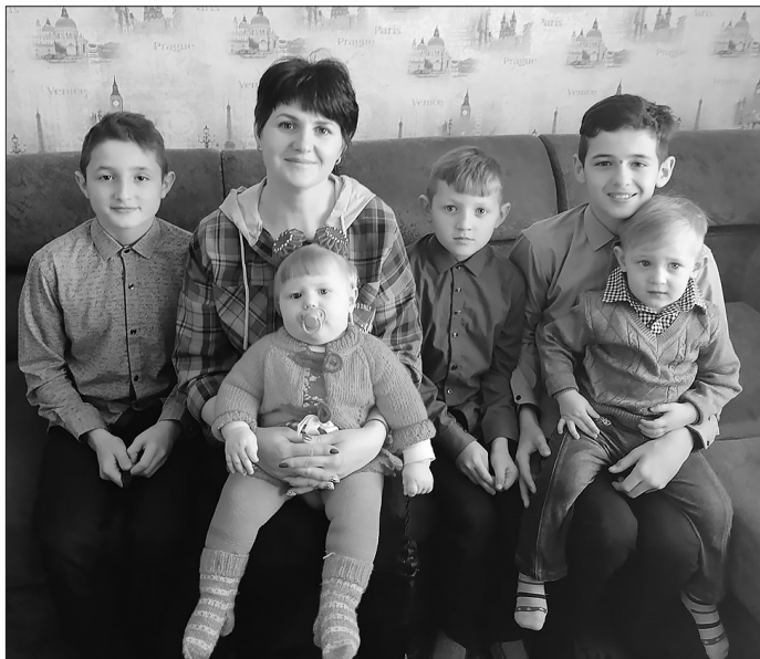
Четыре сыночка и лапочка-дочка