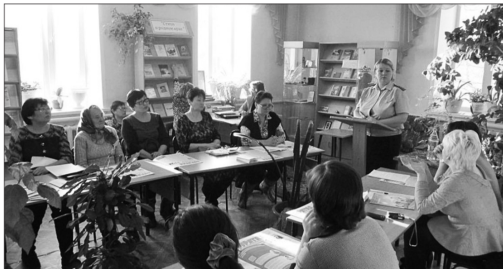
Участники дискуссионной площадки