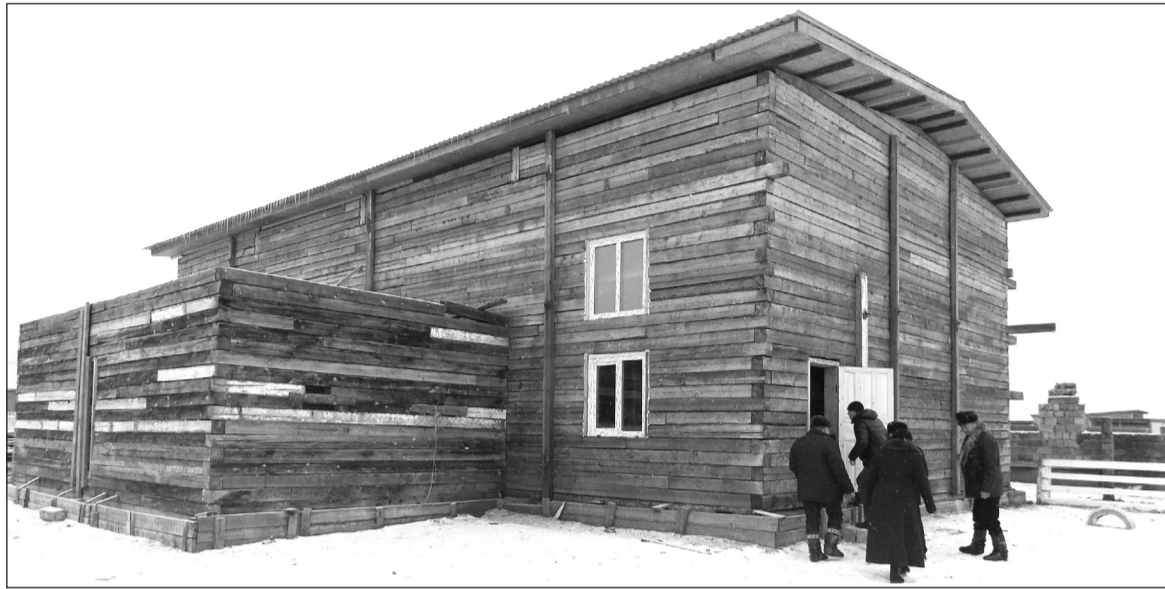
Объединившись ТОСы «Хонхолой» и «Номто» строят спортзал

Активные жители могут многое сделать для своего села