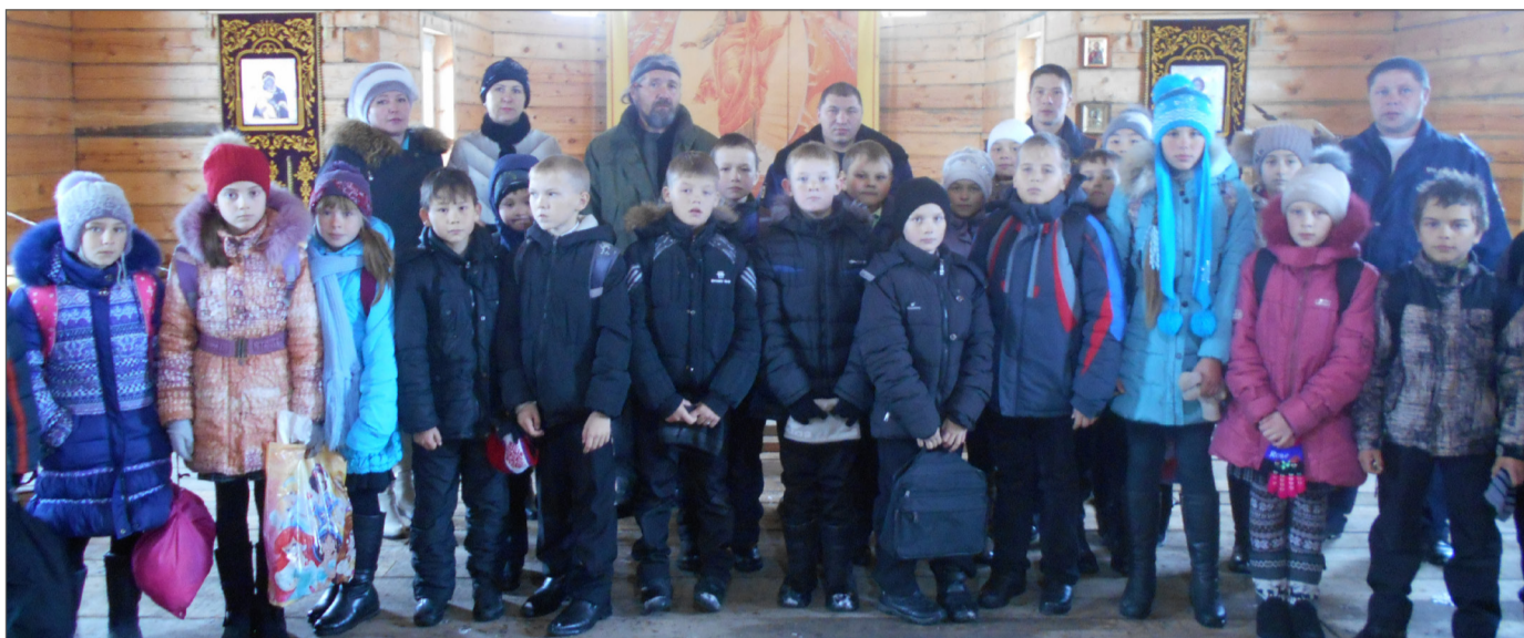
Участники акции почтили память погибших под колесами автомобилей

В школах района прошли уроки безопасности