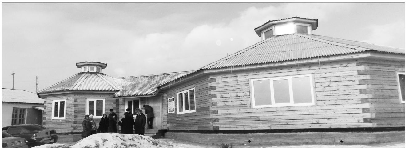
Борцовской юрте требуется отопление