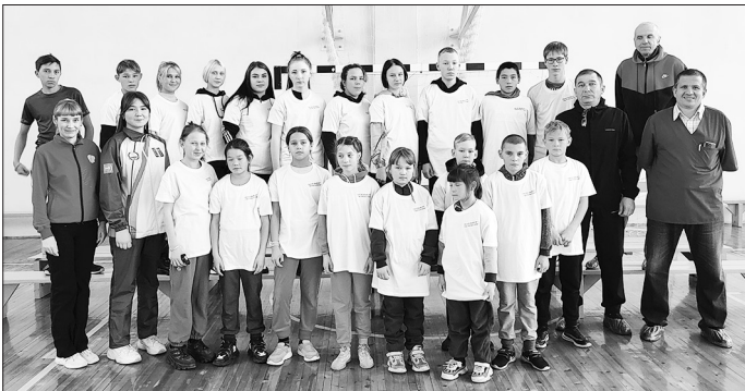
Участники спортивного мероприятия «Курению - нет! Здоровью - да!»

Проблема употребления алкоголя, табака, психоактивных и наркотических веществ среди подростков и молодежи, в настоящее время является достаточно актуальной и требует особого внимания и решения, так как представляет угрозу здоровью населения в целом.