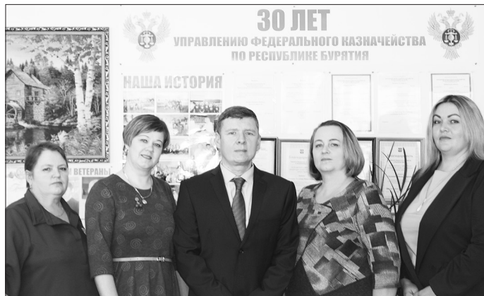
Бичурский коллектив казначеев

— И таких нововведений в деятельности казначейства, наверное, немало?