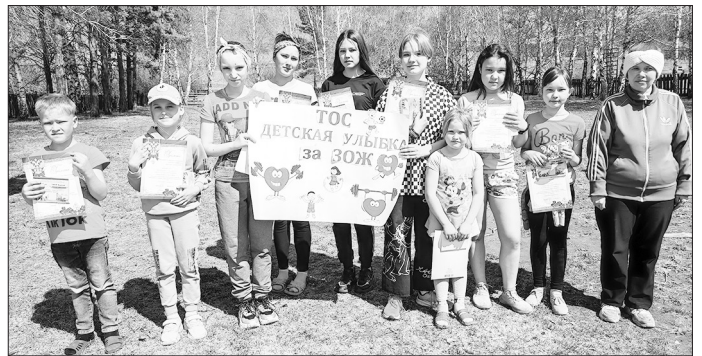
Участники спортивного мероприятия «Спорт против вредных привычек»