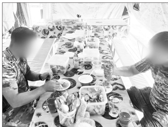
Ежедневно разнообразное меню для бойцов