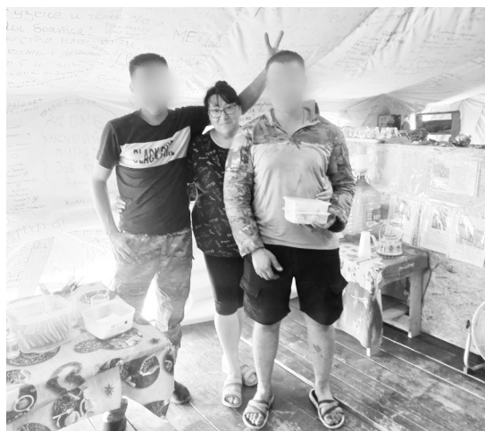
С собой — позы друзьям-служивцам