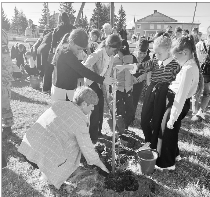
В этот день высадили 10 саженцев