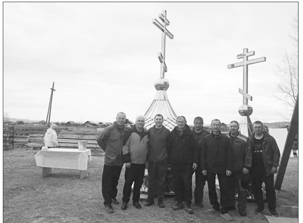
Строители и спонсоры строительства церкви