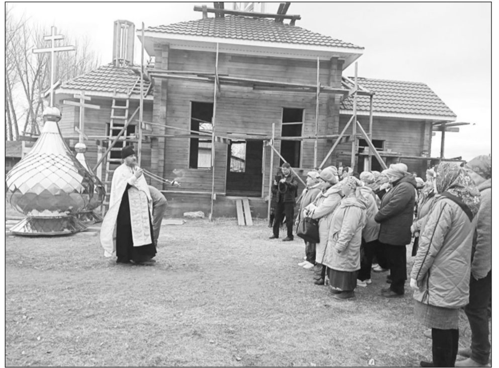
Момент освящения колоколов