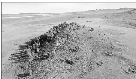
Вид Чёрной сопки с квадрокоптера