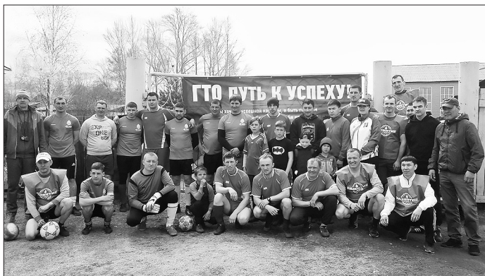
Единый день сдачи ГТО

Все больше бичурян выбирают здоровый образ жизни