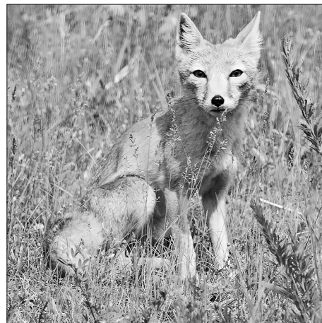
Корсак — степная лисица

(По материалам альманаха «Тропою чудес»)