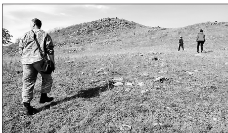
Восхождение на сопку неумотительно