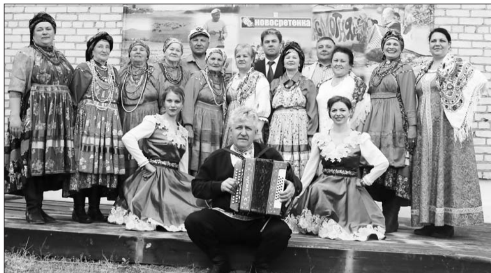
Встреча румынских староверов в с. Новосретенка

13 учащихся Бичурской ДШИ приняли участие в пяти различных республиканских конкурсах, в которых завоевали 3 диплома лауреата. Вик-