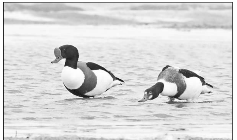
Благородные утки пеганки