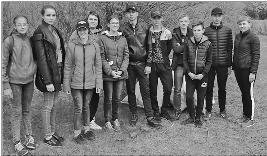
Участники экологической акции