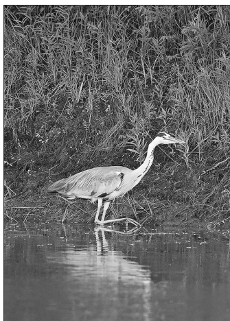
Цапля на рыбалке

Легче всего цаплю наблюдать на озере Харасун, которое имеет вид подковы. Внутренний берег его порос камышом, осокой и мало посещается людьми. Здесь всегда можно увидеть спокойно стоящую цаплю. Если она дремлет, то складывает свою длинную шею на спину, а если рыбачит — вытягивает её вверх, словно журавль или гусь. Увидев в воде добычу, цапля молниеносно хватается её своим