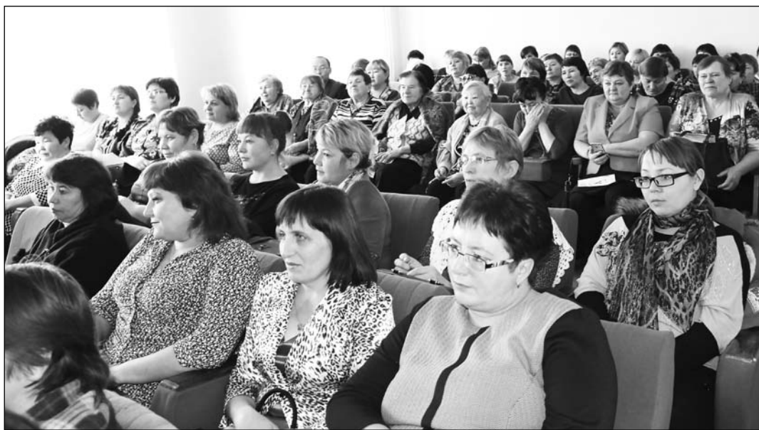
В зале райадминистрации представители поселений района

М естное отделение «Женщины Бурятии» провели 17 ноября конференцию женщин Бичурского района, посвященную Дню матери.