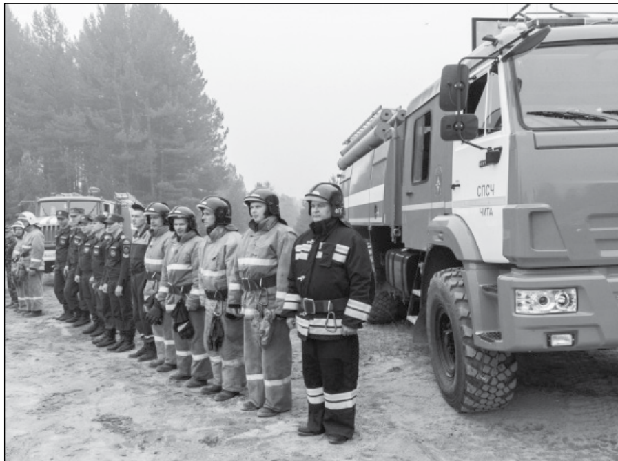
Пожарные расчеты МЧС РФ по РБ обеспечивают безопасность поселений в условиях лесных пожаров.

С 1 января 2017 года на территории Бурятии сотрудники Республиканского агентства лесного хозяйства, МВД по РБ,