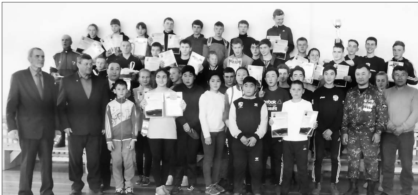
Все участники остались довольны итогами соревнований