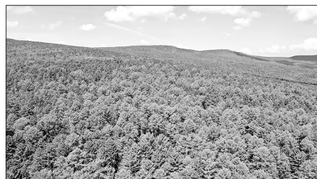
Панорама кедровика.