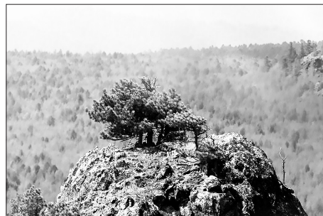
Карликовый кедр на скале

Надо заметить, что сосна сибирская или сибирский кедр сугубо наше, российское дерево. Лишь малое количество сосны сибирской (менее 1%) растёт в Казахстане и Монголии. Поэтому, без пафоса можно сказать, что кедр является национальным достоянием России. Картина распространения кедра