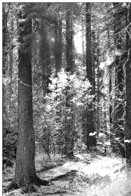
В подлеске — рябина

говорит о том, что это морозостойкая континентальная относительно влаголюбивая лесная порода.