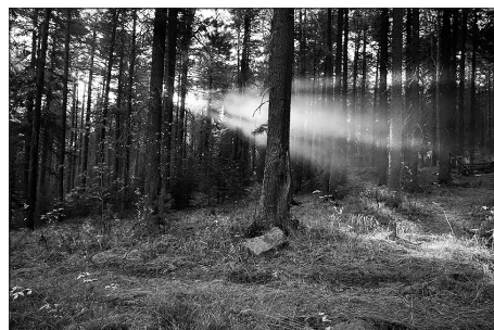
Утро в кедровом лесу