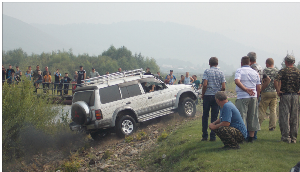
Один из трудных подъемов

Улица Ленина 28 августа была как никогда оживленная. Шли люди, непрерывным потоком ехали машины. Все спешили на новое мероприятие. Организаторы назвали его иностранным OFF-ROAD DRIVE (офф-роуд драйв). А если по нашему, то это езда по бездорожью.