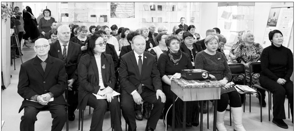
Основное мероприятие прошло в зале районной библиотеки