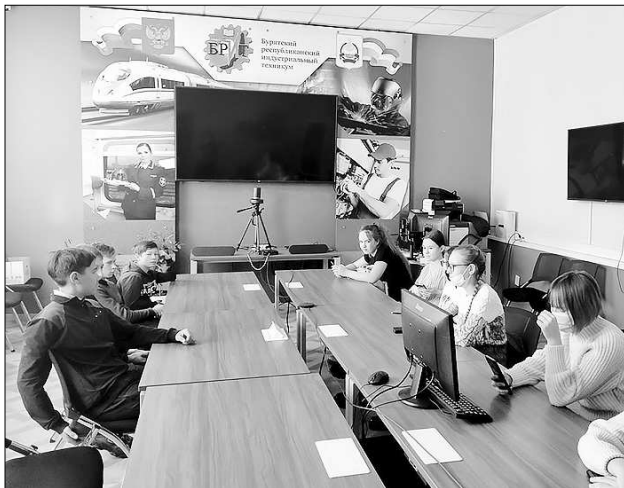
В Центре опережающей профессиональной подготовки