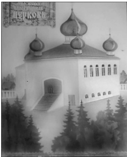
Хилкско-Владимирская церковь. Художник Борис Тубанов

Известна история о воздушном крестном ходе над Москвой, который остановил наступление немецкой армии.