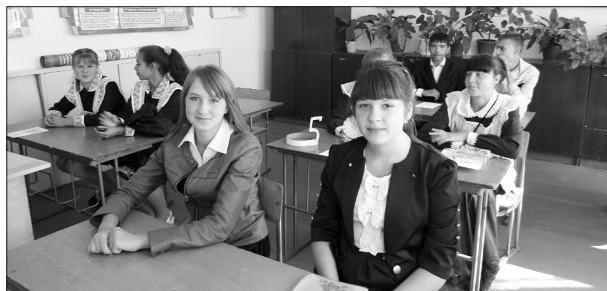
В стенах родной школы чувствуешь себя уверенно

— Буквально вчера один из родителей сказал: «В нашем микрорайоне школа, как церковь. Это место, где всё светло, доброе и хорошее, здание, куда можно пойти». Считаю, что это справедливо. Например, когда проходит новогодняя ёлка, мамы