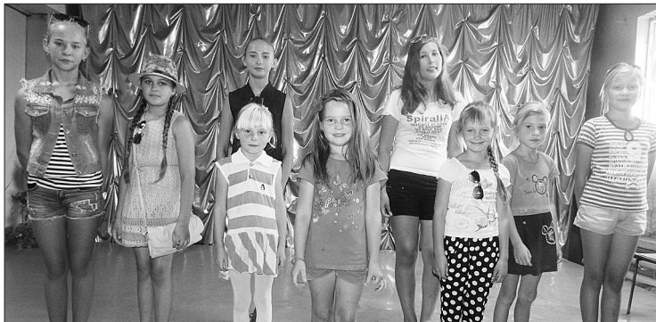
Участницам ансамбля не приходится скучать