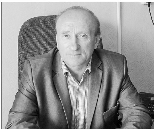
Избирательной комиссии предстоит большая работа

— Два года назад выборы в нашем районе проходили по мажоритарной системе, то есть по большинству голосов. С этого участка освободилось два мандата, следовательно, необходимо избрать двоих депутатов. Но в избирательном