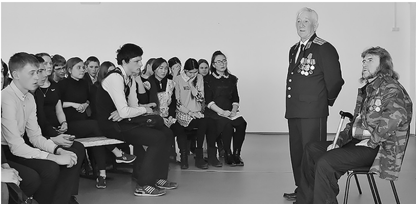
На встрече в Окино-Ключах

В Бичурском районе проходят мероприятия, посвященные 30-летию вывода советских войск из Афганистана. Началом стали митинги 15 февраля в Бичуре и в посёлке Сахарный Завод и урок мужества в Бичурской школе №5. Бичурская центральная библиотека подготовила комплексное мероприятие под названием «Афганистан болит в моей душе».