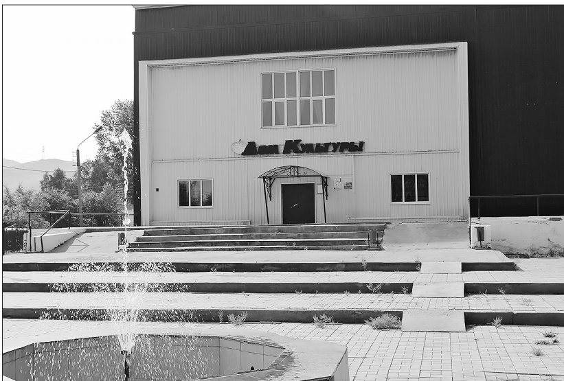
Бичурский районный Дом культуры

Дети из глубинки часто хотят попасть в «большой город», потому что здесь «всё есть». Когда-то и я мечтала выбраться из деревни, чтобы ходить в музыкальную школу, театр, кино. С 1 января 2019 года по Указу Президента России «Культура» вошла в перечень национальных проектов. И теперь это направление активно развивается не только в «больших городах», но и в сёлах Бурятии.