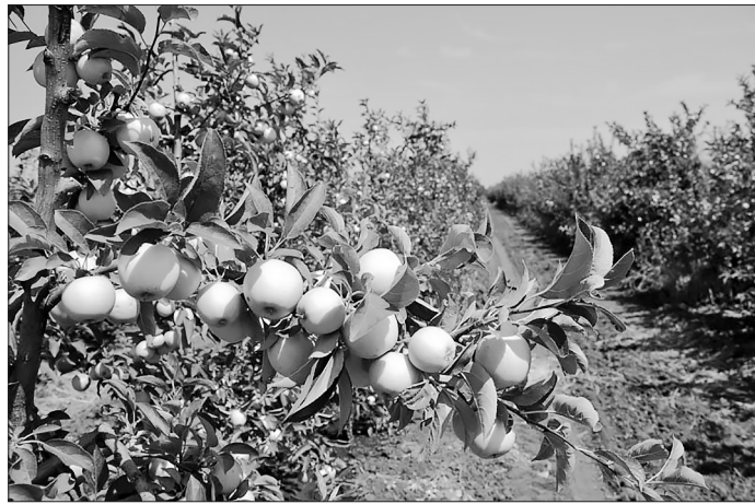
Яблоневый сад.