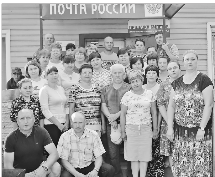
Коллектив Бичурского почтамта

Администрация и профсоюзный комитет Бичурского почтамта