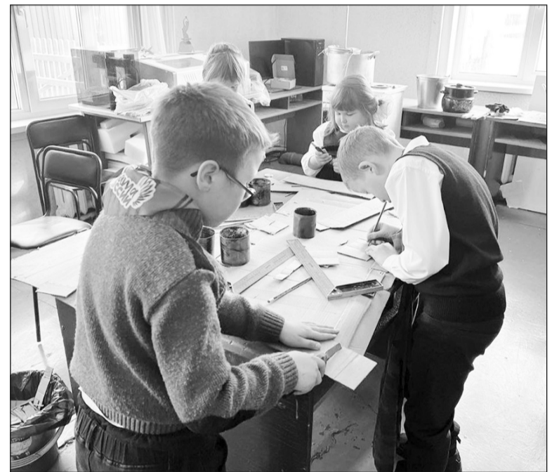
Воспитанники ДДТ за изготовлением свечей

Напоминаем, что идёт постоянный сбор средств на технику для наших бойцов в группе «Бичура с вами, ребята». В 25-ю армию вместо квадроцикла купили машину. Но она ещё требует вложений, на это 100 тысяч рублей есть. Купили ещё одну машину в долг по следующей заявке в 11-ю ОДШБ, передали 200 тысяч, остались должны 244 тыс. рублей. Поэтому сбор не останавливается. Реквизиты: