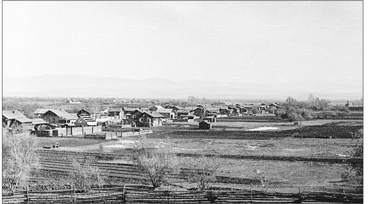
В огородах всегда было место для конопли