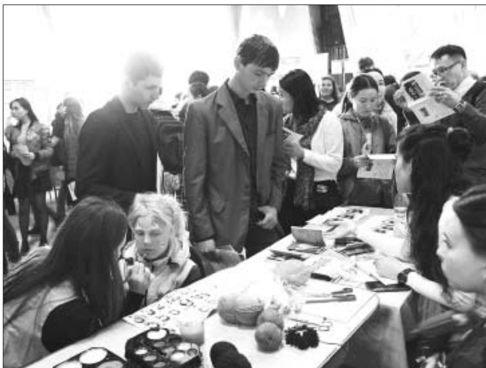
Выбирай — не стесняйся!

Со сцены с музыкальными номерами выступили студенты Байкальского колледжа недропользования, Байкальского колледжа туризма и сервиса, Кяхтинского филиала медицинского колледжа, Бурятского республиканского техникума строительных и промышленных