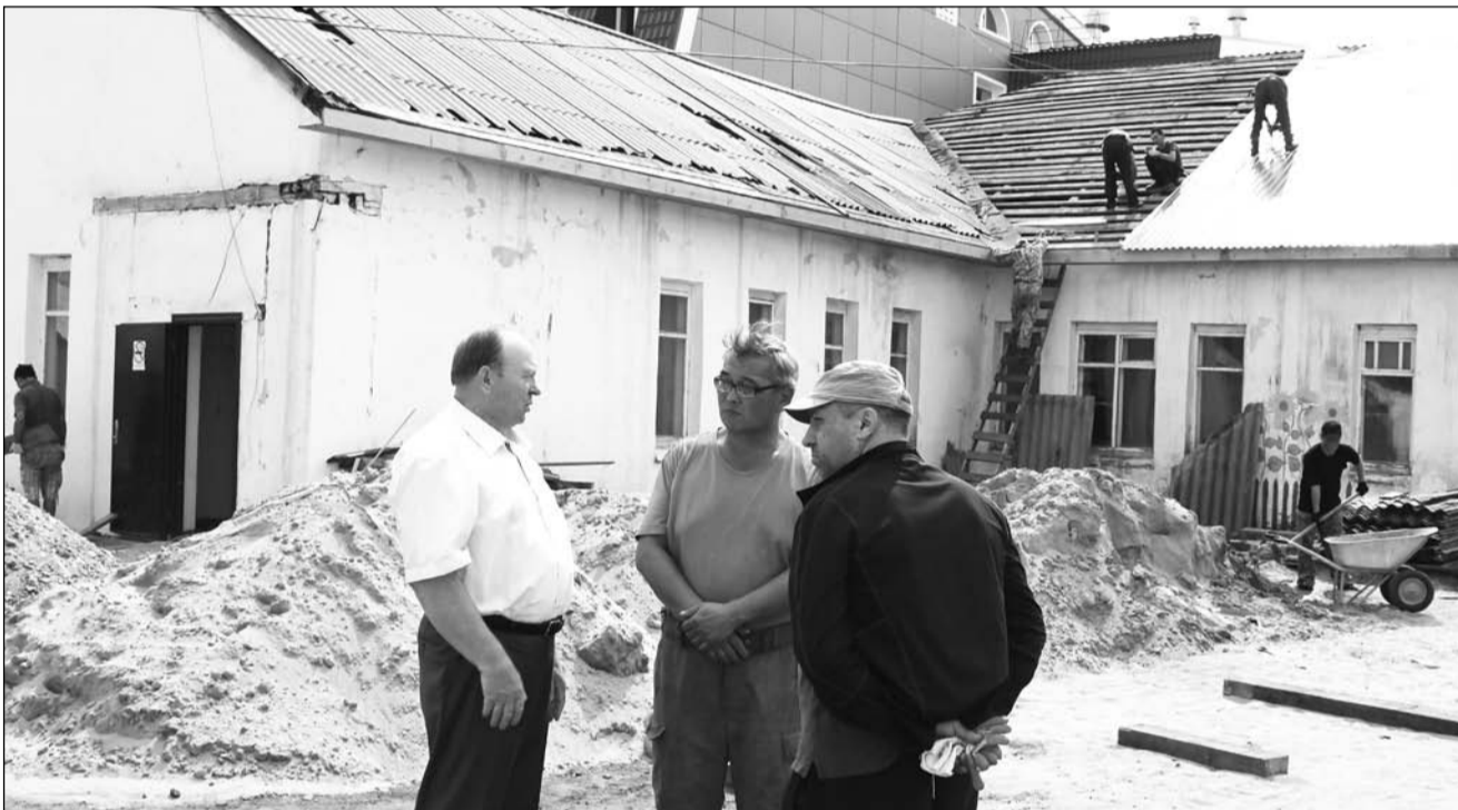
Обстоятельный разговор со строителями

В Бичурской районной больнице идет капитальный ремонт терапевтического отделения