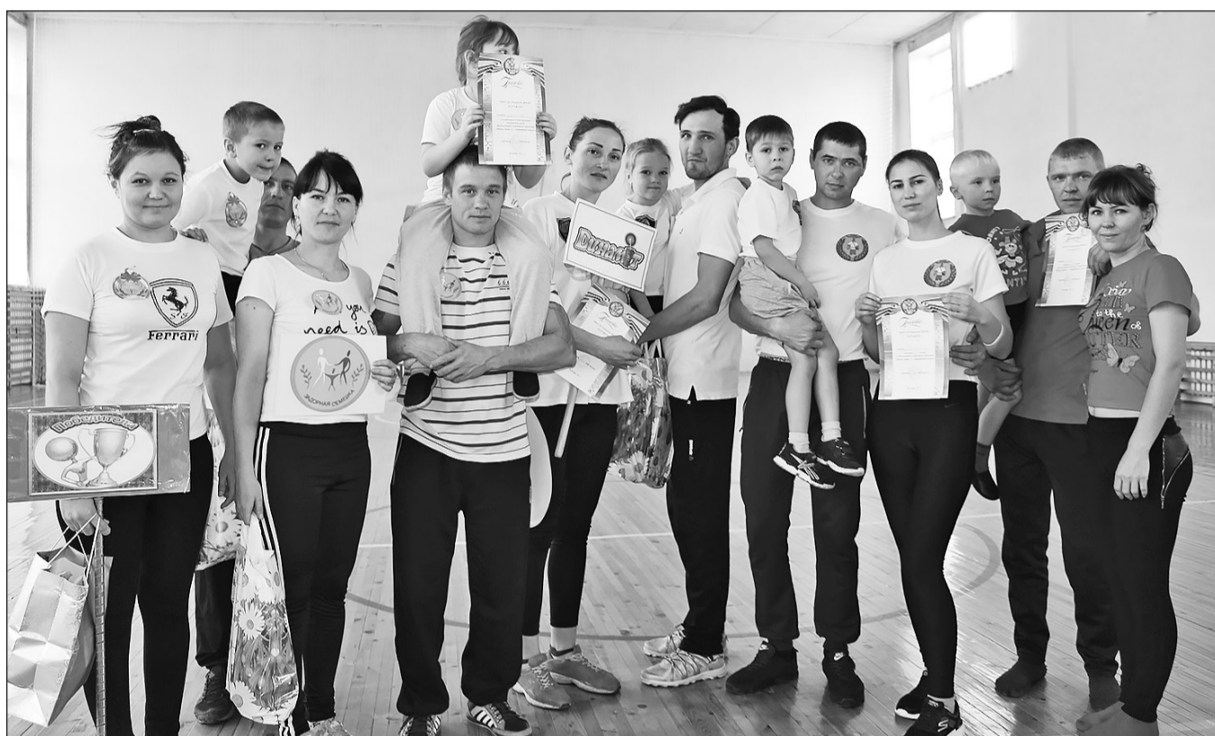
В соревнованиях «Папа, мама, я — спортивная семья» проигравших не было

Педагоги Бичурской детско-юношеской спортивной школы 8 ноября провели праздник спортивных семей. Физкультурно-спортивные соревнования проходили при поддержке Региональной общественной организации содействия развитию детско-юношеского спорта в Бичурском районе «Лидер».