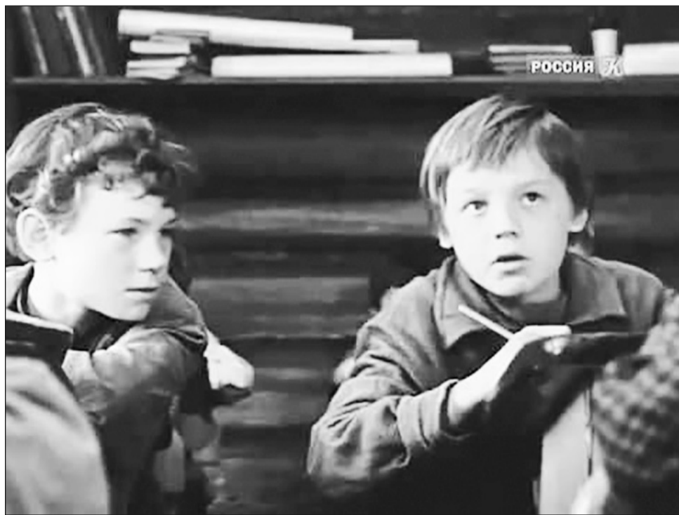
Фото из фильма «Уроки французского»

Отец не придал значения её словам. Для него было очевидно, что работа на благо кол-