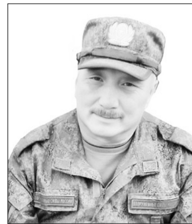
Администрация и жители Бичурского района