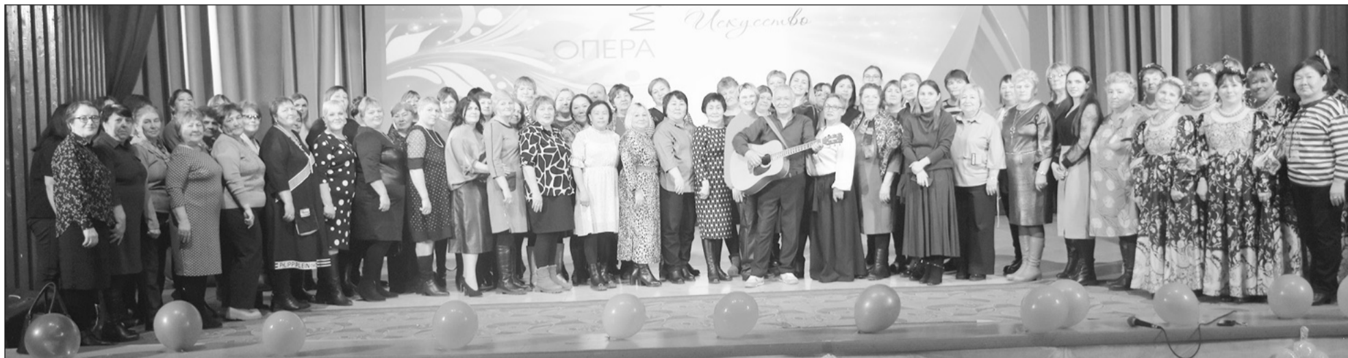
Коллектив работников культуры Бичурского района

В 2024 году деятельность в отрасли культуры осуществляли четыре учреждения культуры: управление культуры Администрации района; Бичурская централизованная библиотечно-краеведческая система (28 библиотек в т.ч. 26 сельских); районный Дом культуры (РДК, 31 сельский клуб, 7 народных коллективов); Бичурская ДШИ с отделениями в с. Малый Куналей, в улусе Шибертуй.