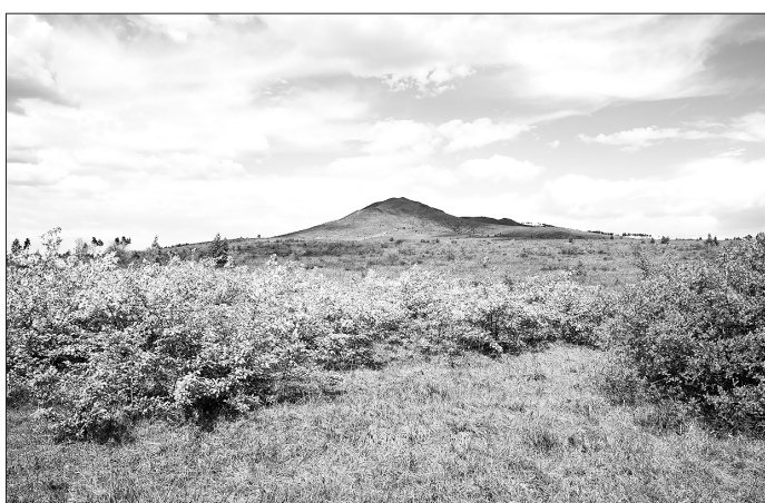
Вид на Большой Кумын от дороги

Восхождение на Кумын будет интересным приключением. Найдите и внимательно рас-