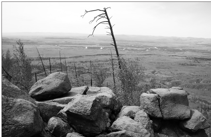
Вид с Большого Кумына на долину Чикоя

Б ольшой и Малый Кумын хорошо знают жители западной части Бичурского района, а также краеведы. Справедливости ради надо сказать, что это уже Кяхтинский район. Но не совсем так... Потухший вулкан Малый Кумын расположен в аккурат на границе между Бичурским и Кяхтинским районами. Наша экспедиция, изучая Малый Кумын, «захватила» заодно и его старшего брата, гору Большой Кумын. По уверению местных жителей, потомков монголов, здесь «сидит» хозяин местности Кумын-Хан.