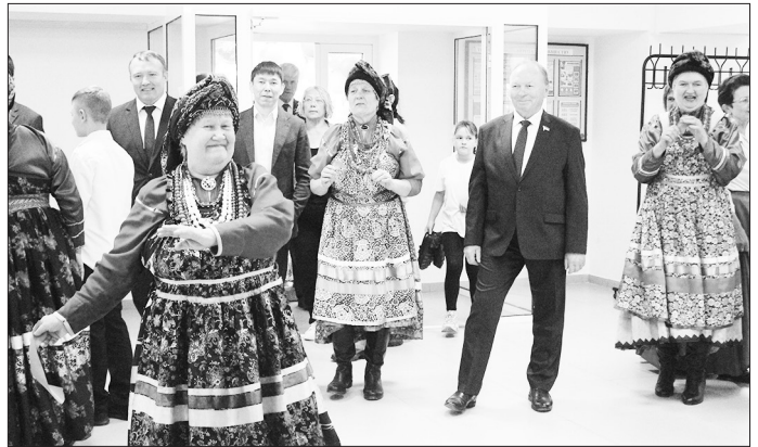
В фойе гостей приветствовал народный ансамбль «Воскресенье»