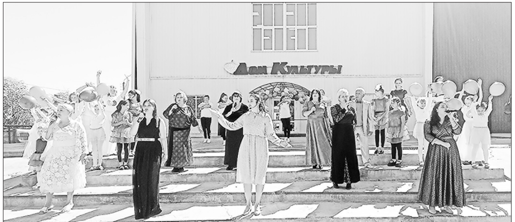
Поздравляют творческие коллективы РДК

— У нас много успешных творческих коллективов, таланты есть в Доме детского творчества, в школах. Пусть Дом культуры служит искусству, а искусство принадлежит народу. Пусть люди, особенно молодые, приходят сюда обогащаются духовно и становятся настоящими гражданами Российской Федера-