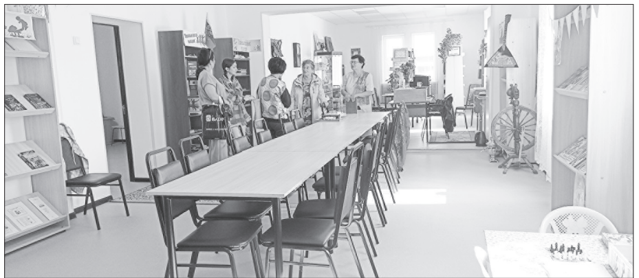
Сельская библиотека преобразилась

— В нашем селе большой праздник. Мы очень рады такому событию. Думаю, жители, дети и взрослые будут чаще приходить к нам. Поэтому будем работать с новыми силами. Организуем новые кружки, клубы по интересам, будем развивать спортивную секцию.