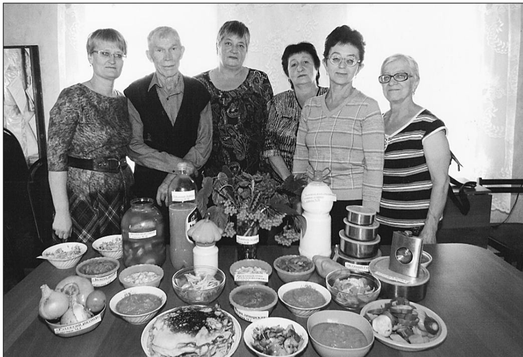
Стол украсили «Дары осени»

«Унылая пора! Очей очарованье!» — эти бессмертные пушкинские строки мы вспоминаем каждый год с приходом осени. И если со словами «очей очарованье» согласны все, то насчёт «унылой поры» с любимым классиком можно и поспорить.