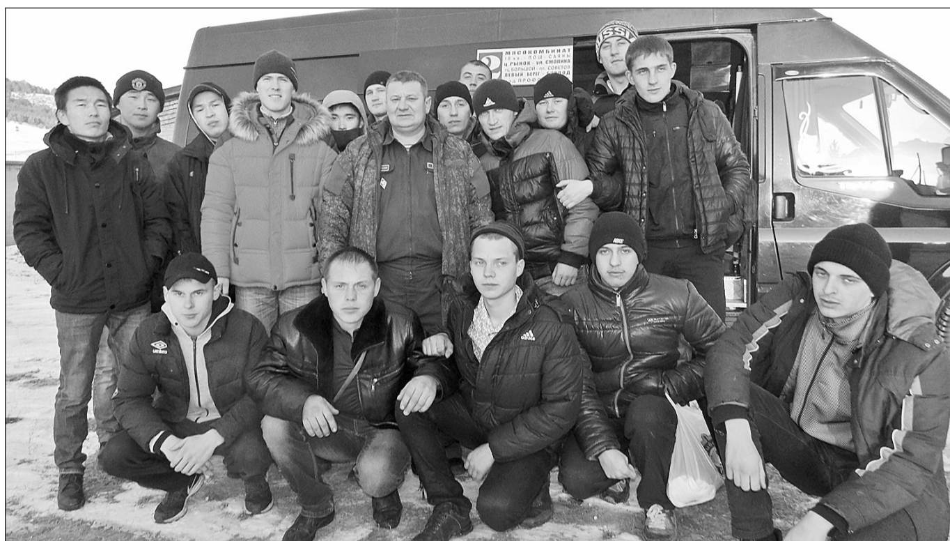
«Вы служите, мы вас подождём!»

В Бичуре прошла первая осенняя отправка ребят в ряды Вооружённых Сил