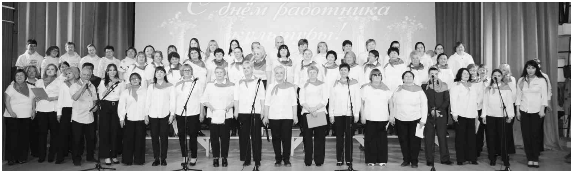
Хор работников культуры. Март 2023 г.

В Бичурском муниципальном районе функционируют районный Дом культуры, 31 сельский клуб, центральная библиотека, 29 сельских библиотек, детская школа искусств с отделениями в с. Малый Куналей, в у. Шибертуй. Нормативная обеспеченность учреждений культуры в районе составляет 100%.