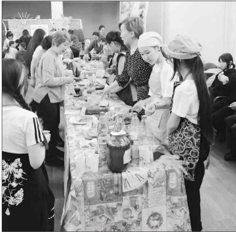
На ярмарке в Шибуртуе

Отдельно скажем о билютайцах. В одном из окраинных сёл Бичурского района не только мастерицы