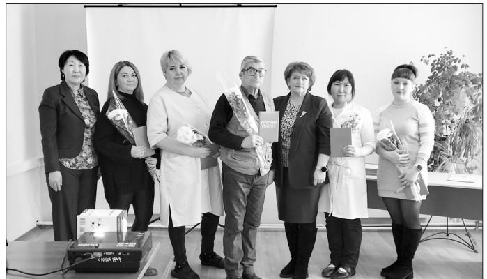
Награды за добросовестный труд

острого вирусного гепатита В, эпидемического паротита, вакциноассоциированного полиомелита, опасных инфекционных болезней. Среди мер профилактики — строгое соблюдение санитарных правил, своевременная иммунизация (охват не менее 95%), санитарное просвещение населения и своевременная медицинская помощь пациентам с инфекционными заболеваниями.