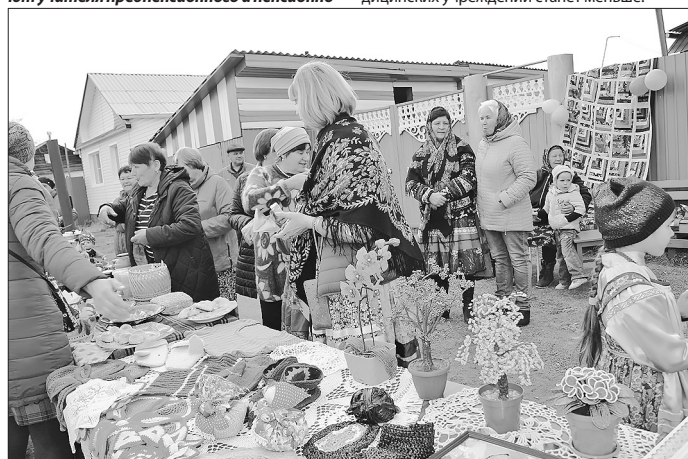
Самое яркое событие года — праздник улицы Коммунистическая