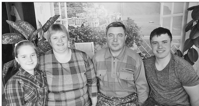
Для семьи счастливой нужно — жить в любви и очень дружно!

Чтобы разводить скот, нужны сенокосные угодья. Поэтому начали с паевых земель, пригодился пай отца, потом выкупили часть паевых земель у тех, кто хотел продать, часть покосилых людей просто отдали пай. Так постепенно у нас набралось 25 га. Чтобы об-