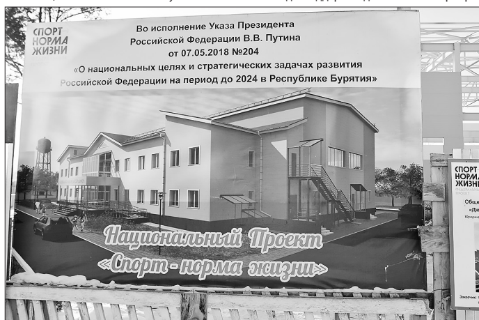
Таким будет ФСК

— Необходимо улучшить высококвалифицированную медицинскую помощь и меры по профилактике заболеваемости. Если болезни выявляются на самом первом этапе, то лечение быстрое и не такое дорогостоящее. Но, как правило, мы имеем уже хроников, которых нужно лечить долго и дорого. Поэтому к вопросам медицины нужно подходить уже с дошкольного возраста. Если мы с детского сада решим вопросы здорового питания, правильной физической нагрузки, тогда, думаю, лет через 15–20 посетителей медицинских учреждений станет меньше.