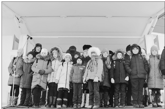
На открытии автоклуба