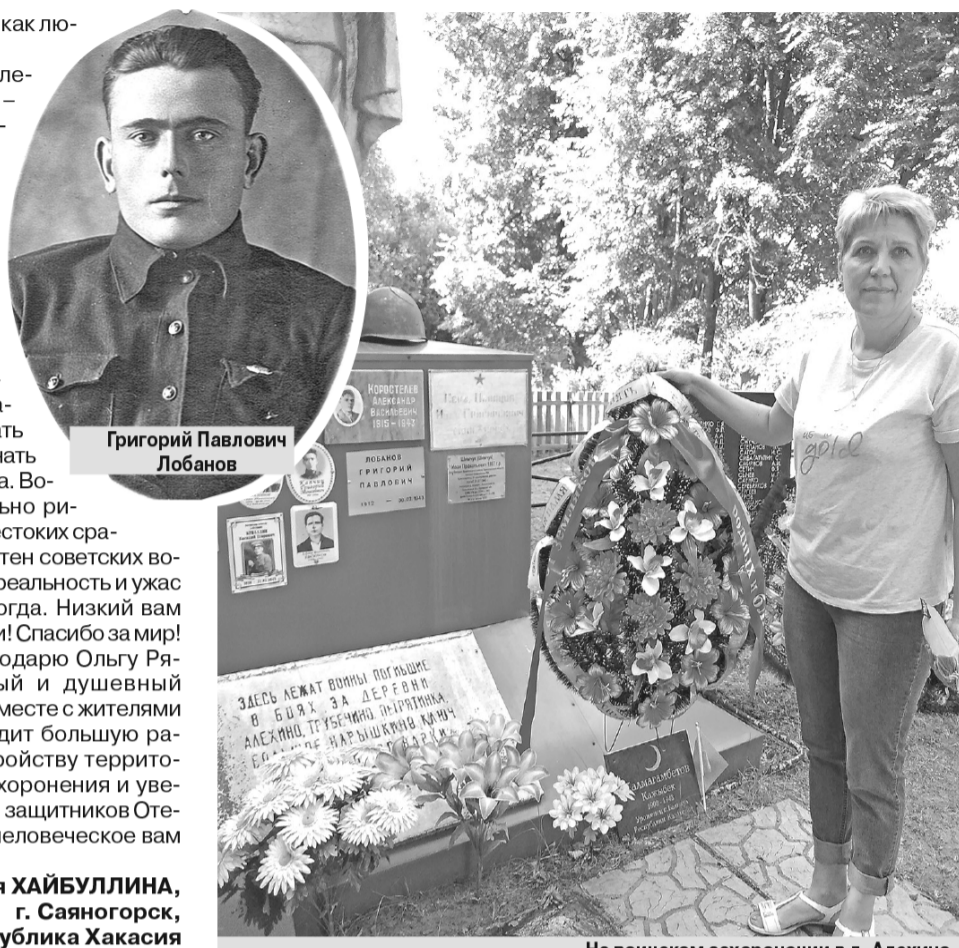
На воинском захоронении в д. Аলেখино.