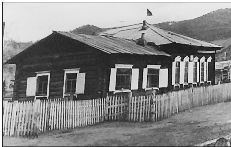
Первое здание школы