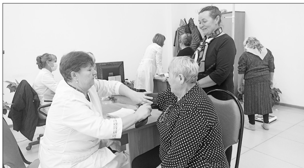
Консультации у медиков

На сцене РДК ветеранов поздравляли представители районной администрации, райсовета, Совета ветеранов и местные артисты.