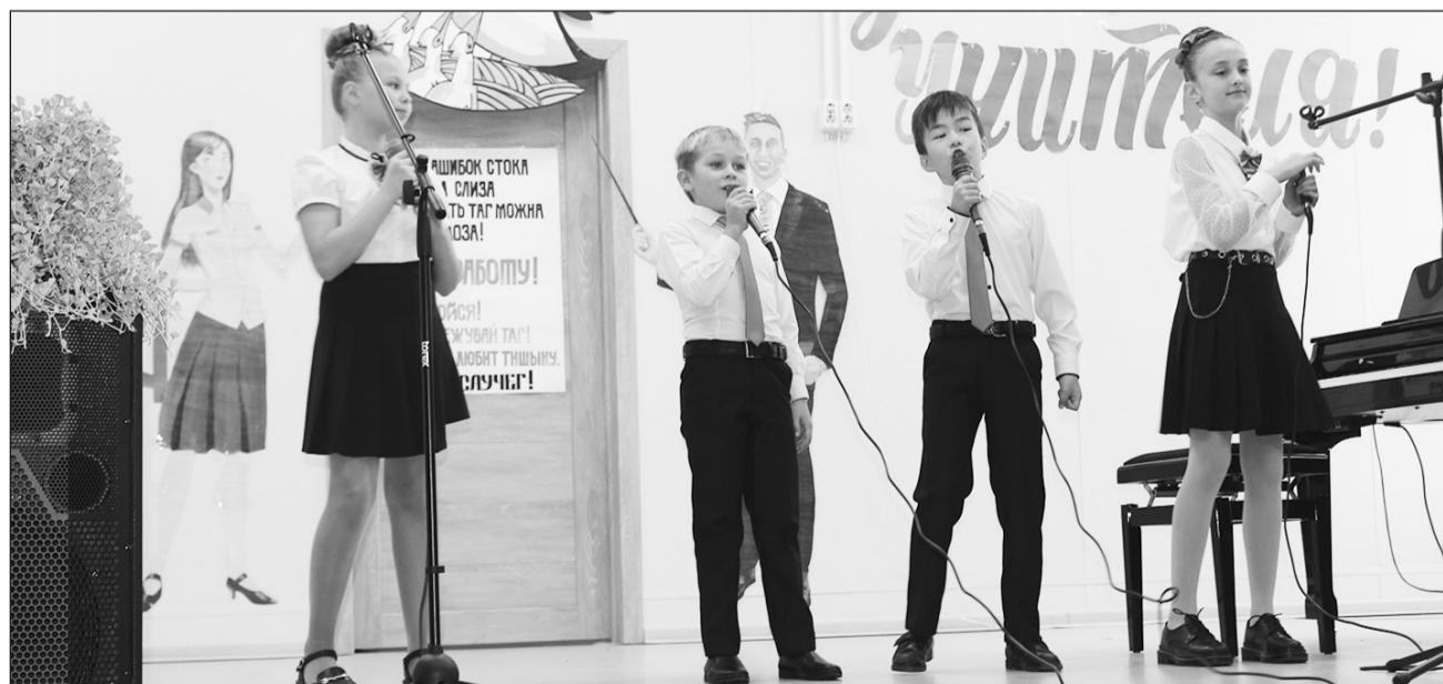
Юные таланты Бичуры