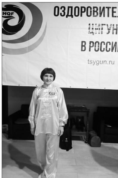
Москва, 2019 г.

— И Цинь Цзин — «гимнастика для сухожилий и мышц». Самые ранние упоминания об этом комплексе относятся ко II веку до нашей эры. Упражнения исполь-