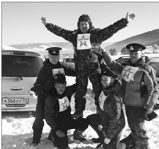
Победители соревнований — команда ДДТ