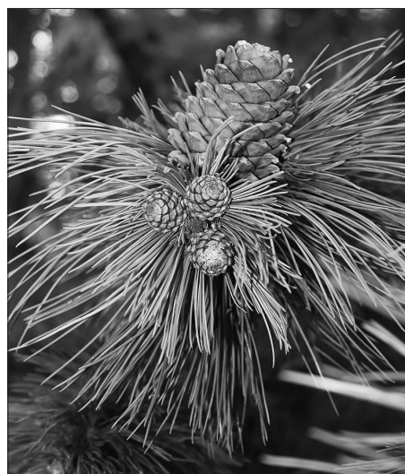
Озимь и спелая шишка.

тур в зимние месяцы (минус 35–40 градусов) в тайге практически не бывает, климат тут стал значительно мягче, нежели в долине. Сыграли свою роль и ставшие нормой обильные снегопады в сентябре-октябре, насыщающие влагой ещё талую почву. Интересно было бы посмотреть метеорологические данные для предгорий Малхана, но, увы, таковые не существуют.