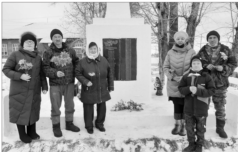
Участники Всероссийской акции «Защитники памяти героев», с. Сухой Ручей