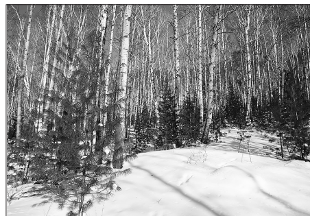
Молодая поросль кедров у дороги