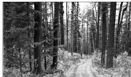
Лесная дорога в кедровом лесу

И ещё одно интересное наблюдение: кедр спускается вниз. Проезжая по старому тракту в верховья Бичуры и мнивов речку Аргентуй, обратите внимание на обочины. Под ярусом смешанного леса масса молодых насаждений — кедров 10–30 летнего возраста. Несомненно, это результат работы кедровки в урожайные годы. Но почему кедр ушел из своего обычного высотного пояса? Ответ, думаю, будет классическим: условия произрастания здесь стали оптимальными для него. Но какие именно? Может сумма плюсовых температур? Старые таёжники заметили, что низкие темпера-