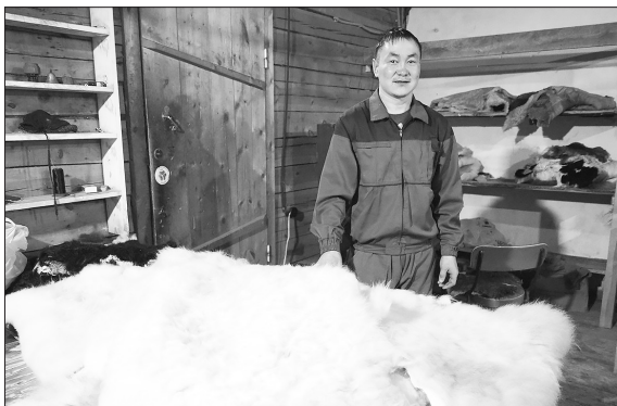
По заказу проектной команды ТОСа в Иволгинском дацане готовят сырьё для работы наших мастеров

С 1 февраля ТОС «Народный умелец» улуса Хаяя сельского поселения «Еланское» начал подготовительную работу по реализации нового проекта. ТОС получил поддержку Фонда президентских грантов в первом конкурсе текущего года.