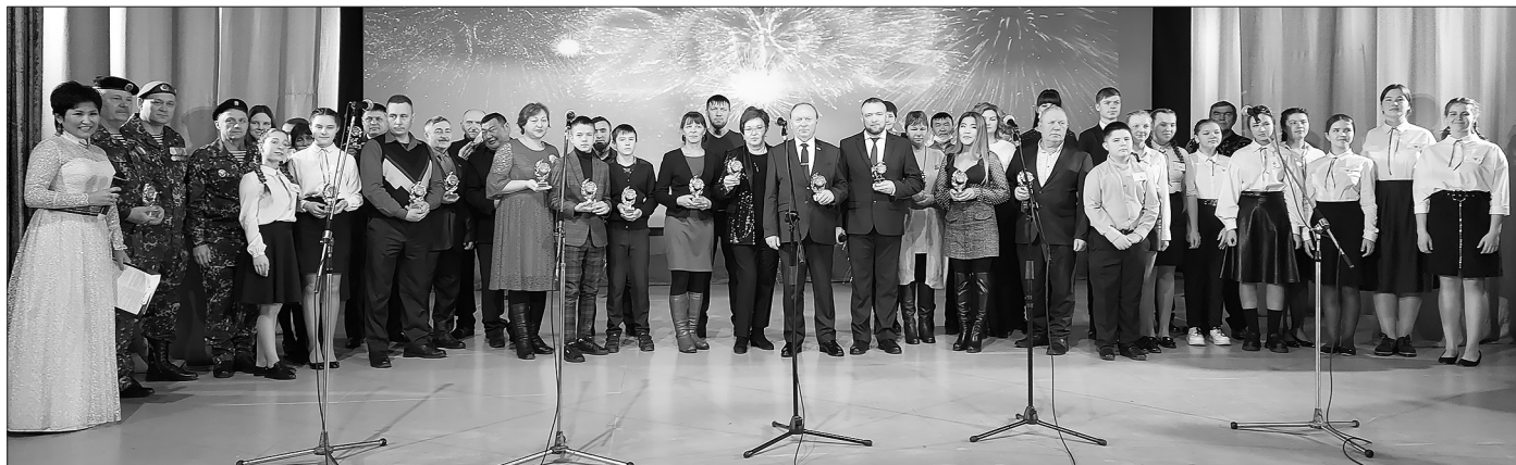
Награждённые на сцене РДК

П о итогам прошедшего года в районном Доме культуры отметили передовиков сельскохозяйственного производства, предпринимателей, педагогов, медработников, спортсменов, правоохранителей, работников культуры, депутатов и организации, которые достигли успехов и внесли вклад в развитие Бичурского района.