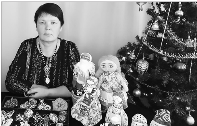
Творчество — лучшее лекарство для души

Когда увлечение востребовано и радует людей