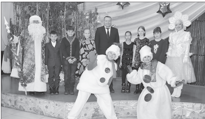
На празднике — 5 класс Еланской школы

В РДК 28 декабря состоялось традиционное мероприятие «Ёлка главы района». Уже несколько лет его проводят для пятиклассников. Таким образом каждый школьник района побывает на таком празднике и получит подарок.