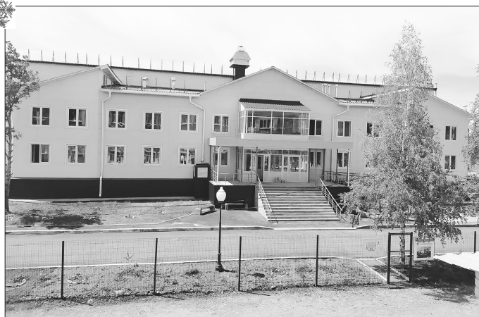
В районе появился ФСК