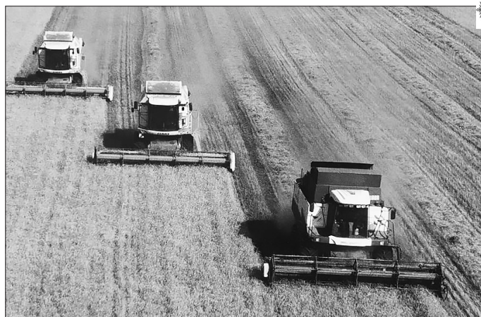
Бичурские хлеборобы собрали рекордный урожай

— Сегодня она отчасти решена, с арендатором помещения, где раньше располагался автовокзал, есть договоренность об организации отдельных мест для ожидающих. Жители района путем голосования в группе «Бичура-инфо» приняли решение не переносить автовокзал. Сейчас отработываем несколько вариантов: строительство пристройки к зданию, где располагался автовокзал или отдельное строительство, участок уже сформирован, но пока нет инвестора. Надеюсь, в 2022 году мы решим этот вопрос, в том числе и с продажей билетов.