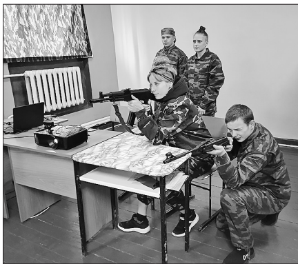
Студенты опробовали учебное оружие

Тир позволит организовать занятия обучающихся в техникуме и подростков села Малый Куналей. Им можно пользоваться для занятий по ОБЖ, готовиться к сдаче норм ГТО,