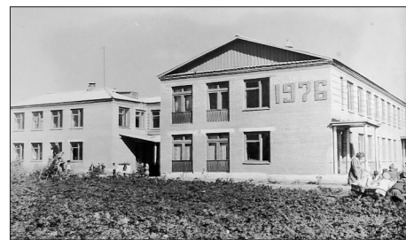
Детский сад на 140 мест

Надо сказать, что работники культуры со всей ответственностью относились и до сих пор относятся к проведению празд-