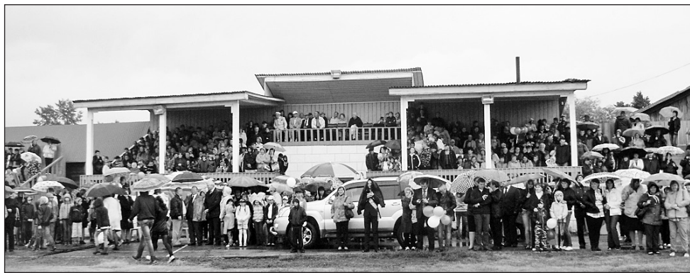
Зрителей не испугала плохая погода