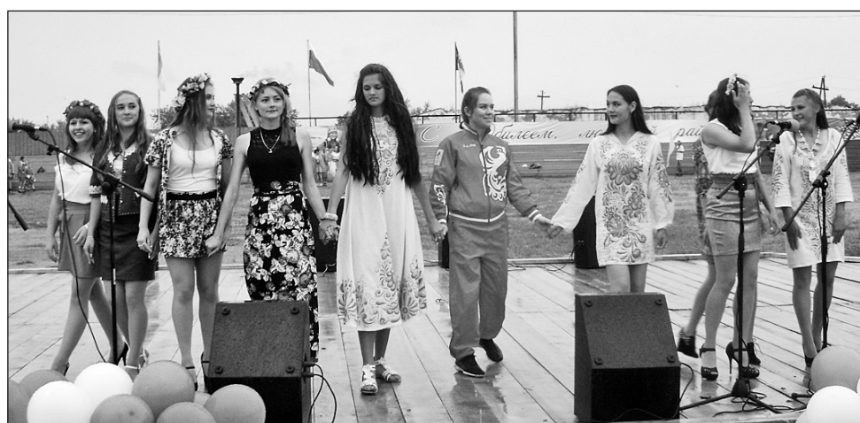
Показ мод от дизайнера Виктории Кузнецовой