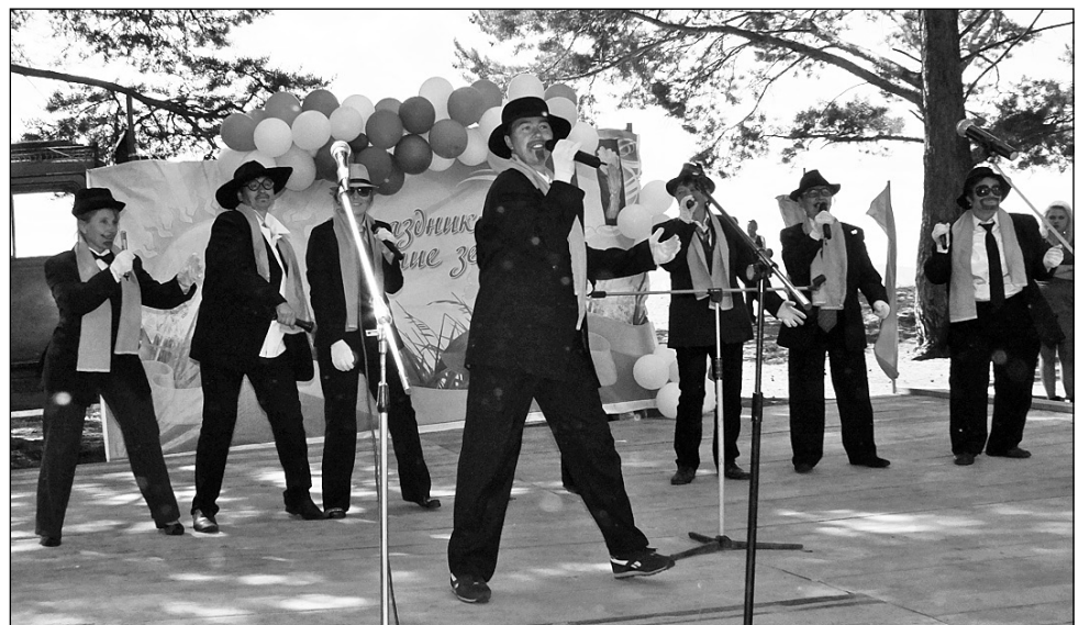
Малокуналейский «Хор Турецкого»