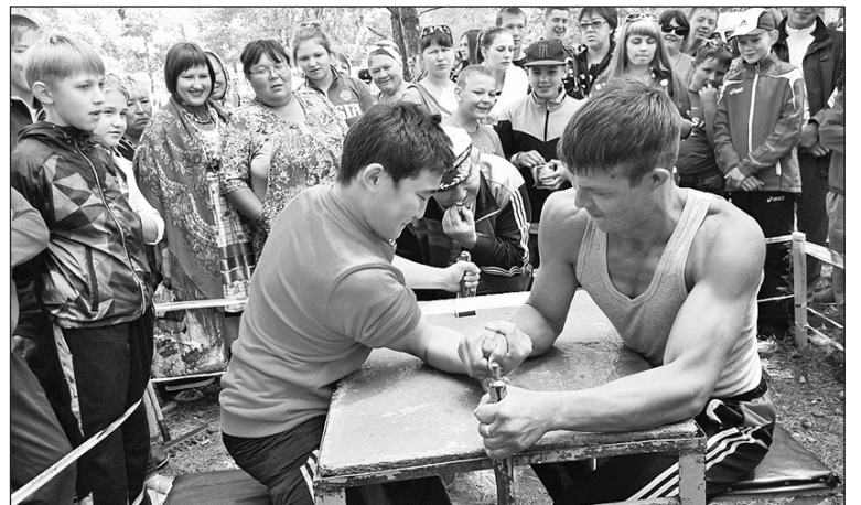
Армрестлинг собрал много зрителей