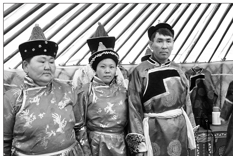
Харлуңцы всех встречали в юрте