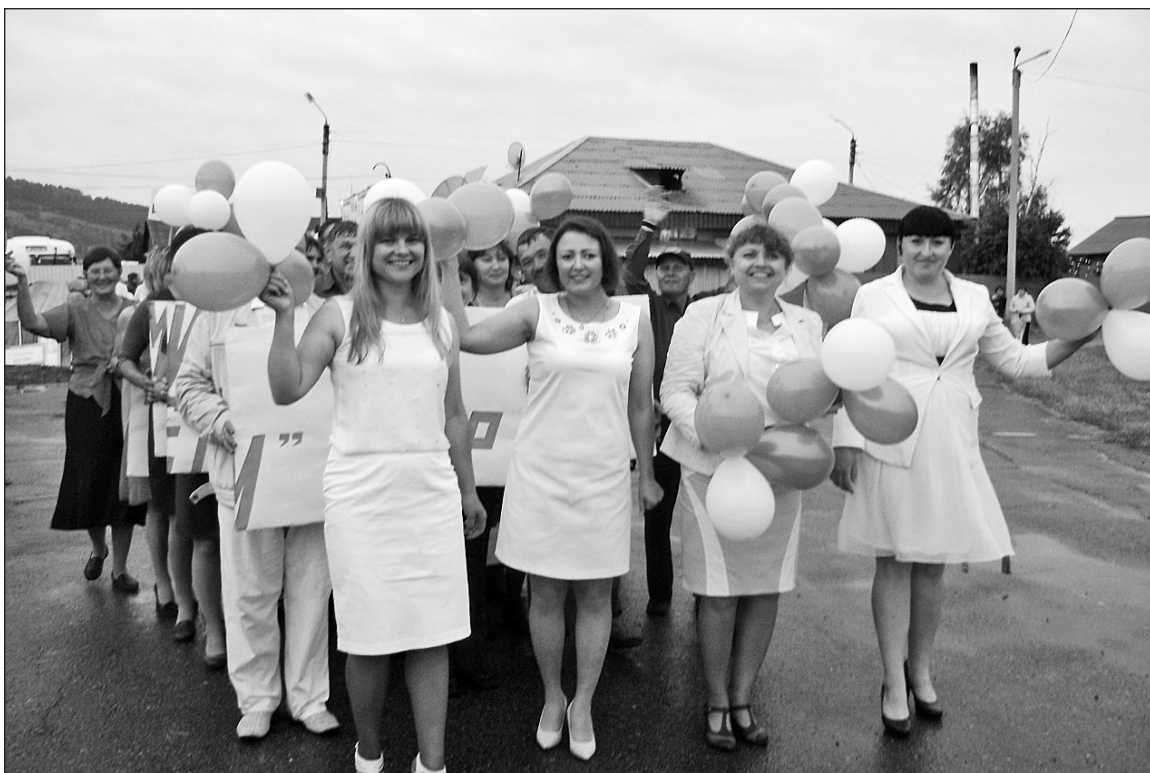
Сотрудники социального центра

Фоторепортаж с празднования читайте на второй странице