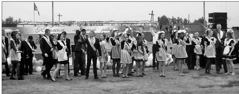
Поздравление выпускников 2015 года