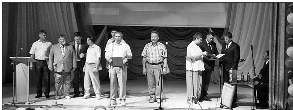
Поздравление от глав районов республики