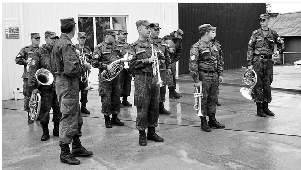
Духовой оркестр (г. Кяхта)