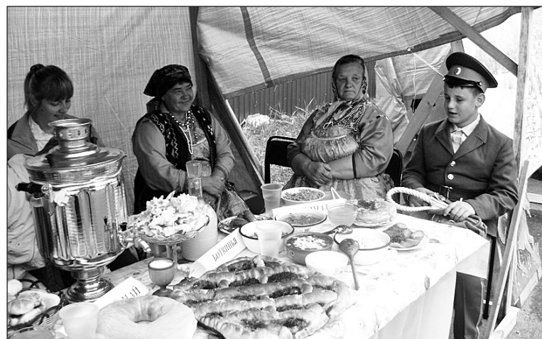
Бичуряне поджидают гостей