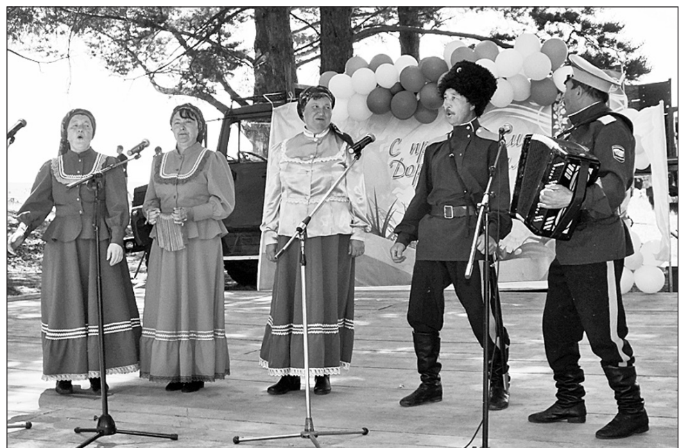
Выступает ансамбль «Калинушка»