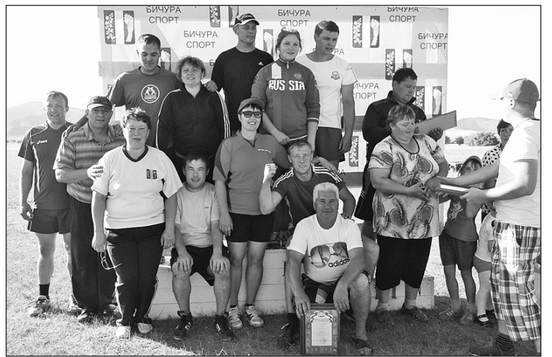
Победители и призеры в соревновании по перетягиванию каната