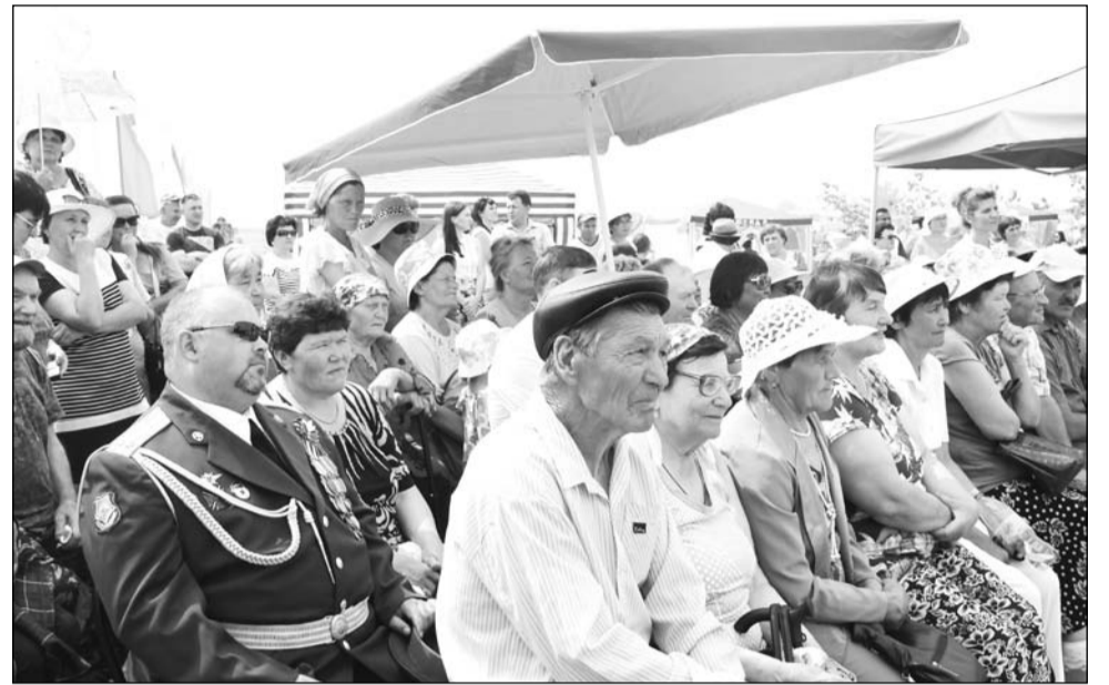
Зрителям была предоставлена разнообразная и обширная программа