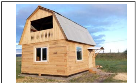
Дома — 470 тыс. руб. 30 м 2 на участке 4 сотки. Можно под материнский капитал. г. Улан-Удэ, с. Сотниково. 8-914-988-68-16.

Магазин обуви «ЧЕТЫРЕ СЕЗОНА» объявляет скидки до 20% на летнюю обувь с 15 июля до 1 сентября 2017 года. Приглашаем за покупками!