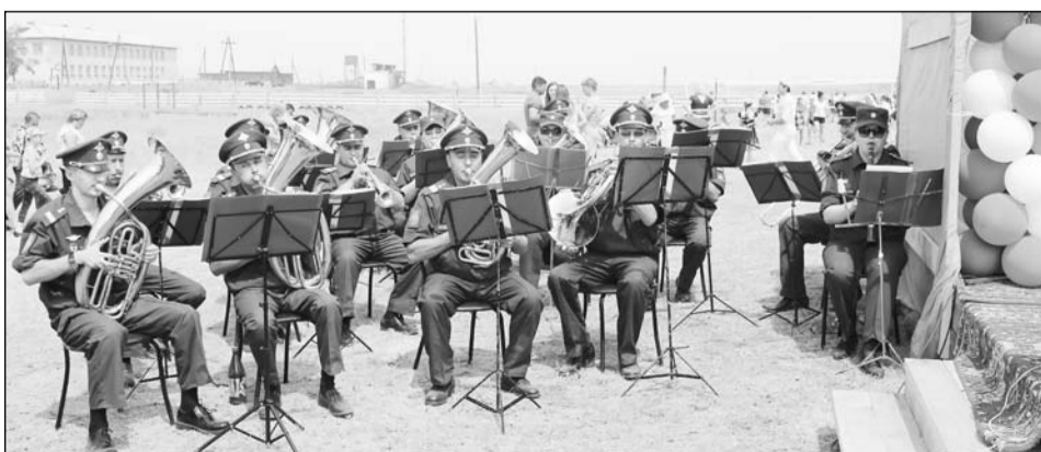
Выступление военного оркестра придало особую торжественность мероприятию