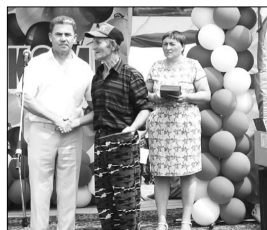
Награждение от главы района