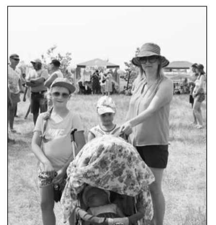
Юное поколение жителей Окино-Ключей