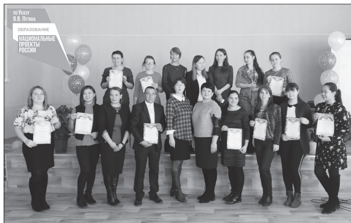
Участники фестиваля молодых учителей

Пять директоров школ и семь учителей начальных классов района в 2020 году стали участниками пробного тестирования по оценке компетентности учителя. Все руководители школ проверили свои управлен-