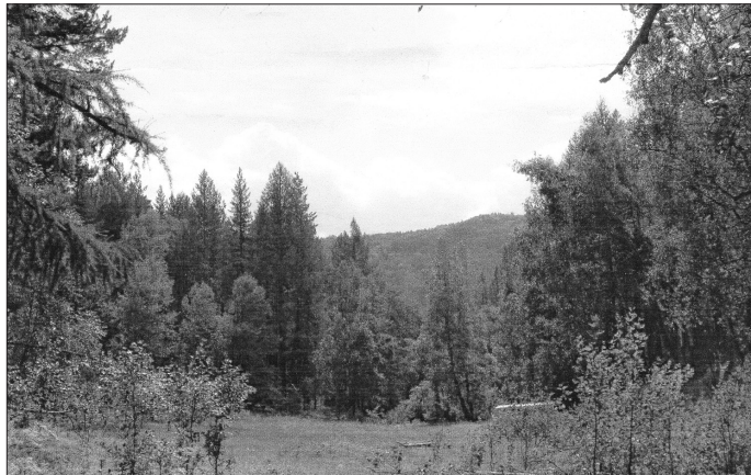
Киретский аршан (луговина). Вид с севера на юг. Родника не видно — он справа вдали. Белееет сарай

бака начинает ворчать, глядя на дорогу. Вскоре там появляются мальчишки-подростки. Они идут «гуськом» по конской тропе тележной дороги. Первый ростом повыше, обут в ичиги, остальные босиком. Норма встаёт и резко лает в их сторону. Хозяин тихо командует: «Нельзя!». Поравнявшись с дедом, ведущий останавливается: «Здравствуй, дедушка!»