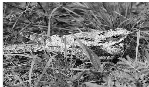
Козодой вжимается в землю

зом. Облик её был странным: пёстрая змеиная окраска, короткий клюв и широкий рот. А ещё обращали на себя внимание длинные крылья, перекрещенные на спине, как это обычно делает кукушка. Маневрировать машиной в этом месте дороги было невозможно, и я решил выйти наружу, по возможности, сделать снимок из другого ракурса. Это было ошибкой: птица мгновенно взлетела и исчезла в кустах. Рассматривая на мониторе камеры снимок, подивился её удивительному облику: это был не стрижь, не пустельга и не кукушка. Вглядываясь в картинку, мысленно прокручивал рисунки из определителей — козодой? Вот тут и сложились, словно в пазле, прелюдии моих наблюдений. Конечно, это козодой!