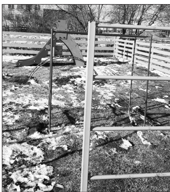
На детской площадке в Новосретенке

В Новосретенское сельское поселение по результатам народного голосования на реализацию проектов поступило 243,3 тыс. рублей.