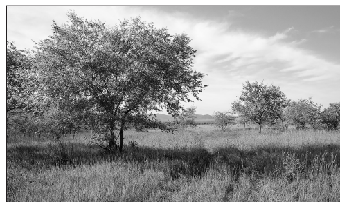
Здесь живёт козодой