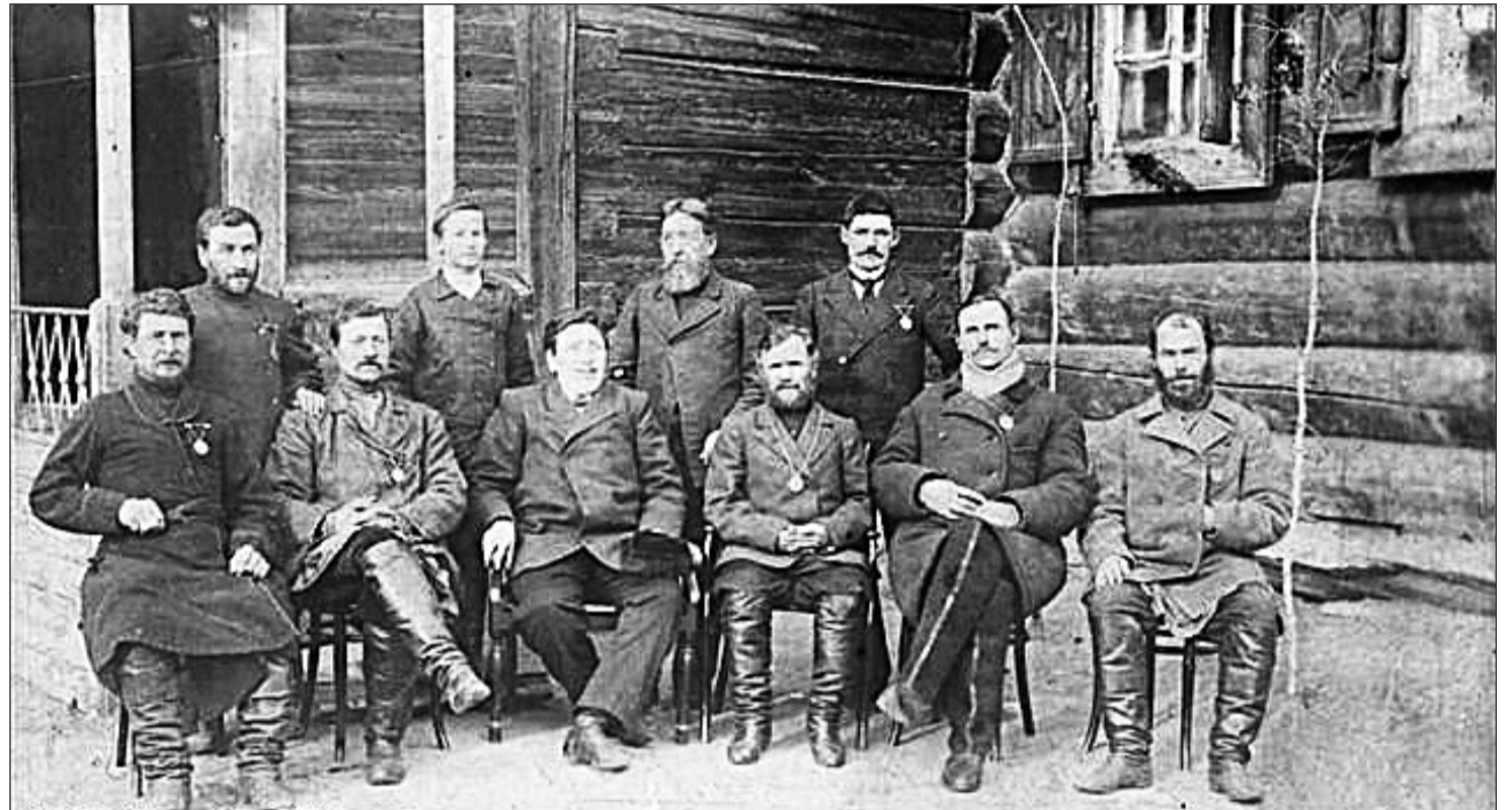
Группа награждённых. Петровск, 1889

Первый лекарь Бичуры был неординарной личностью