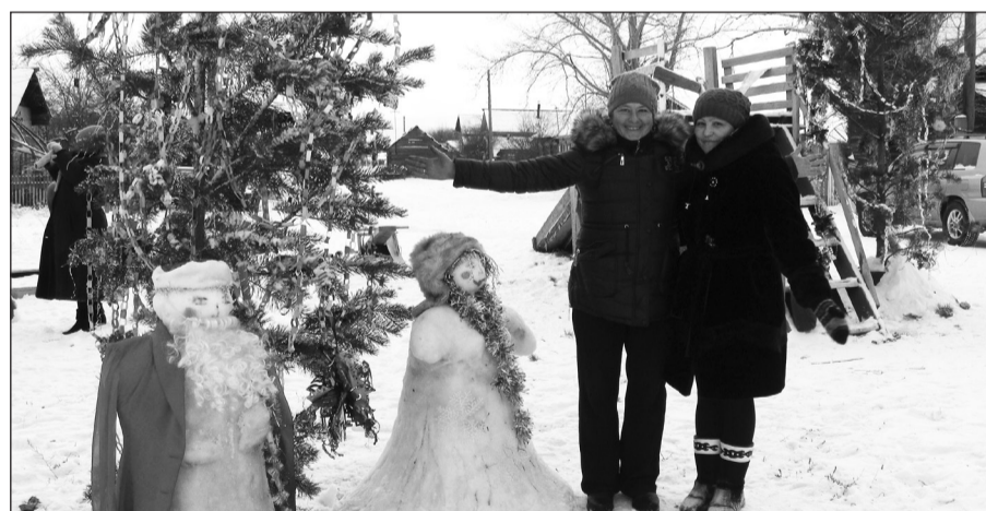
Праздничное украшение поднимает настроение

Подведены итоги районного конкурса на лучшее новогоднее оформление фасадов и зданий организаций, предприятий и частного сектора. Всего на участие в конкурсе поступило 7 заявок: 5 от организаций и 2 от частного сектора. Комиссия, в составе председателя районного Совета депутатов, начальника и специалистов управления культуры, проехали, оценили и сфотографировали новогоднее оформление фасадов и зданий Роспотребнадзора, МУЗ «Бичурская ЦРБ», Пенсионного фонда, ИП Бурдуковская, Бичурского Дома интерната для пожилых и инвалидов, семей Тимофеевых и Савельевых (с. Петропавловка) и ТОС «Надежда» (с. Бичура, ул. Молодежная).