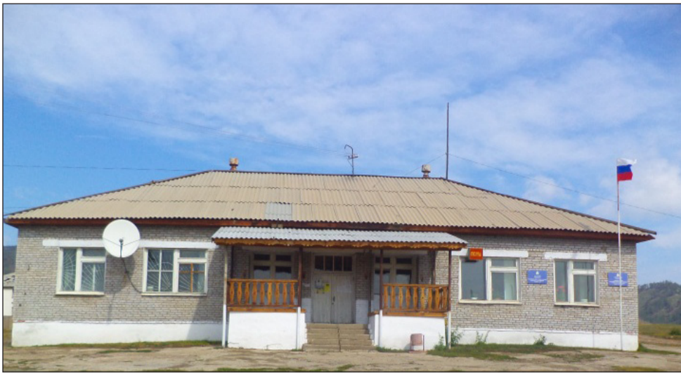
Здание МО СП «Шибертуйское»