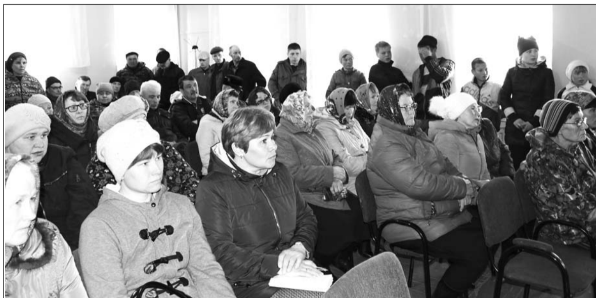
На сходе в Новосретенке

В течение апреля в сельских поселениях прошли собрания жителей. На некоторых из них нам удалось побывать.