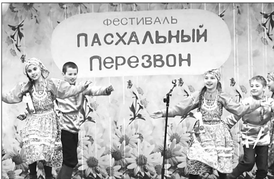
На сцене творческий коллектив «Спектр»

Итоговое мероприятие Бичурского Дома детского творчества