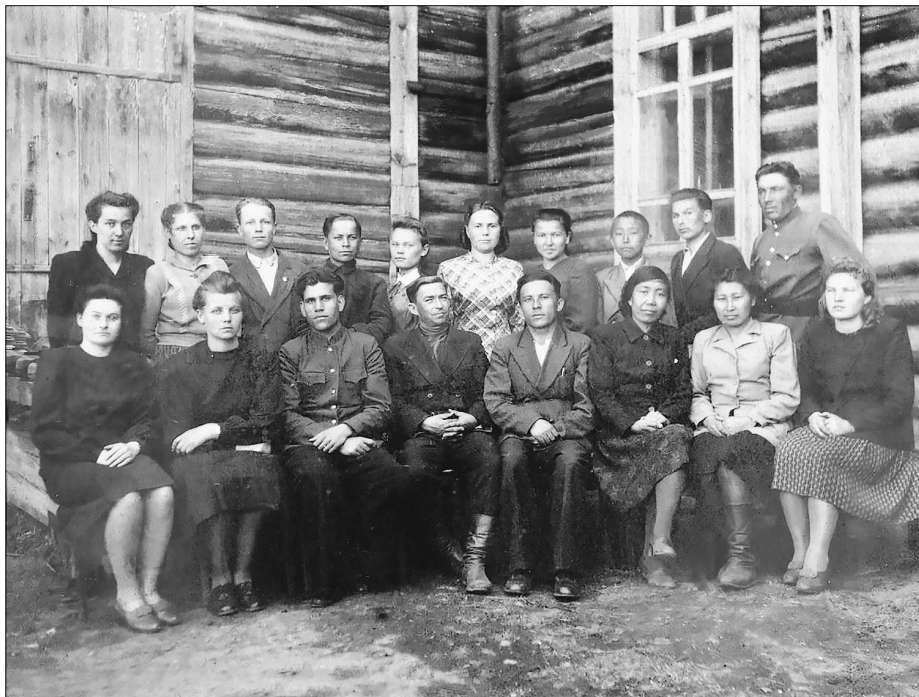
Коллектив школы 40-х годов

К юбилею школьного музея «Родина» в середине января вышла моя статья о создании мемориала учителей БСОШ №1. Не думала, что она вызовет большой резонанс, но это так. Бичуряне помнят учителей и готовы помогать. На сегодняшний день осталось совсем немного мест с пометкой «?».