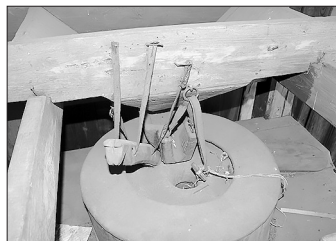
Детали мельницы: короб, конёк, лоток, жёрнов