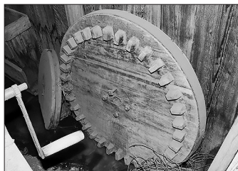
Мельничное колесо с «кулачьими»