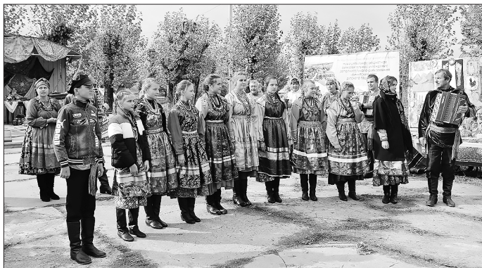
Фестиваль в парке «Молодёжный»