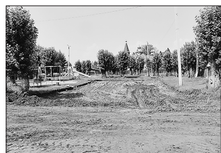
Место выбрано по итогам голосования участников группы Бичура-инфо.24/7

Всего — 26 наименований оборудования. Площадка будет выложена резиновой плиткой.