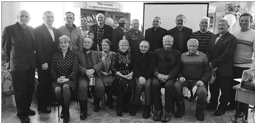
Главная тема форума — патриотическое воспитание подрастающего поколения

М естное отделение РОО «Женщины Бурятии» совместно с районной библиотекой в преддверии Дня защитника Отечества провели форум «Мужчины — наша гордость и защита».