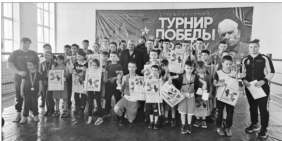
Победители — команда Бичурской ДЮСШ

Первое общекомандное место на турнире занял Бичурский район. Победителей наградили медалями, грамотами, денежными призами и памятными подарками.