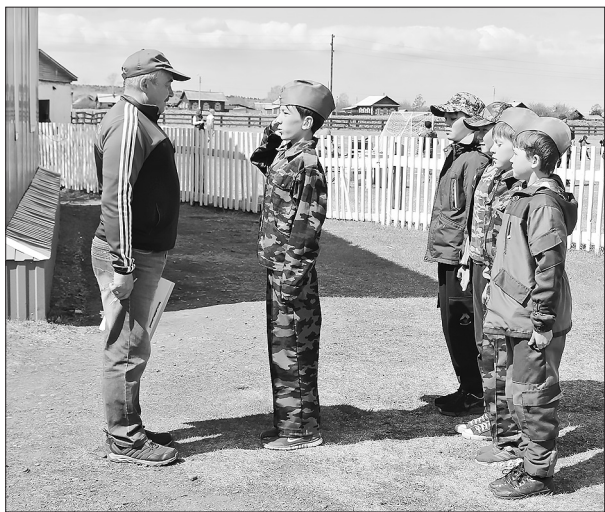
«Хорош в строю, силён в бою»

На территории Бичурского дома детского творчества 13 мая состоялась первая районная военно-спортивная игра «Орлёнок» для учеников 3–4 классов школ района.