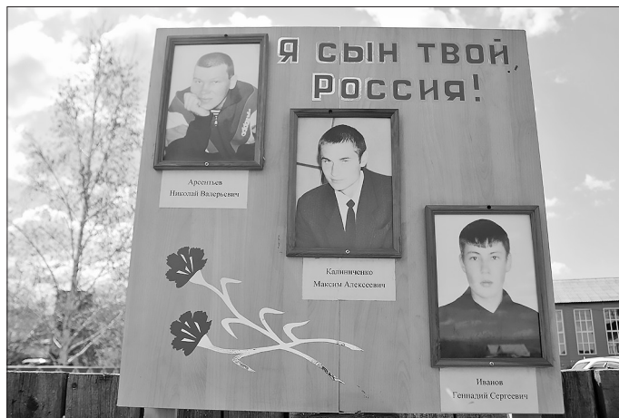
С момента трагедии прошло 16 лет