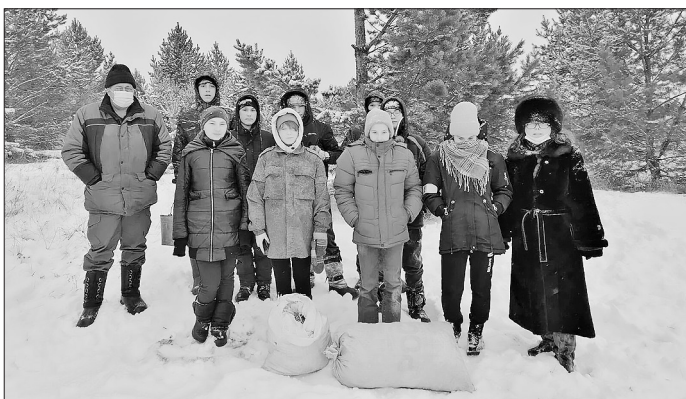
Сбор шишек для восстановления лесов

Сотрудники Буйского лесхоза и лесничества совместно с членами школьного лесничества «Юный лесовод» собрали более 30 кг шишки сосны.