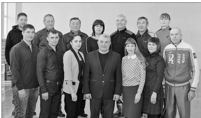
Педагогический коллектив Бичурской ДЮСШ

В течение 2019–2020 гг. с администрации МО «Бичурский район» провели работу по сертификации спортивного зала Бичурской ДЮСШ и получили возможность организовывать