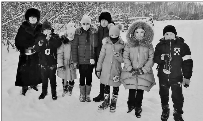
Участники акции «Покорми птиц зимой»

В Бичурском районе ребята из школьного лесничества «Юный лесовод» смастерили оригинальные кормушки из овощей.