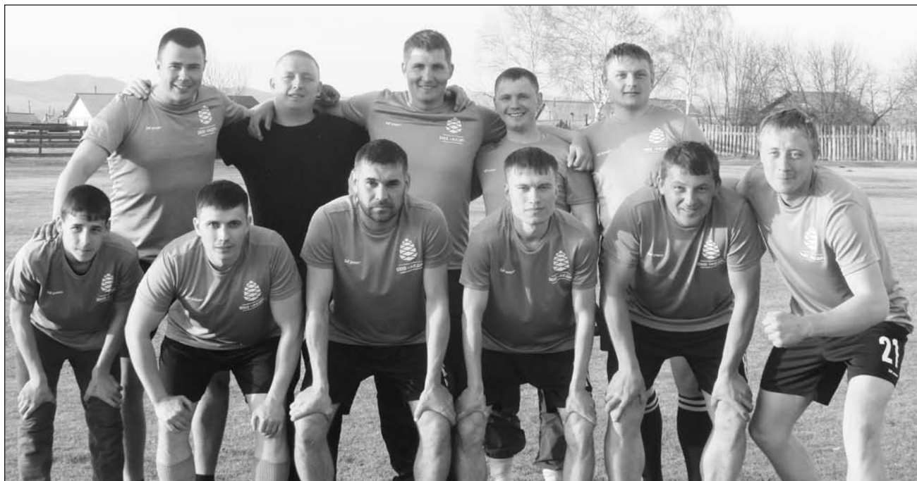
Бичурская команда — активный участник республиканской лиги