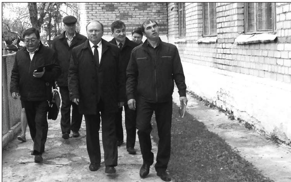
Комиссия посетила несколько объектов образовательного учреждения

В Бичурском районе побывала правительственная комиссия