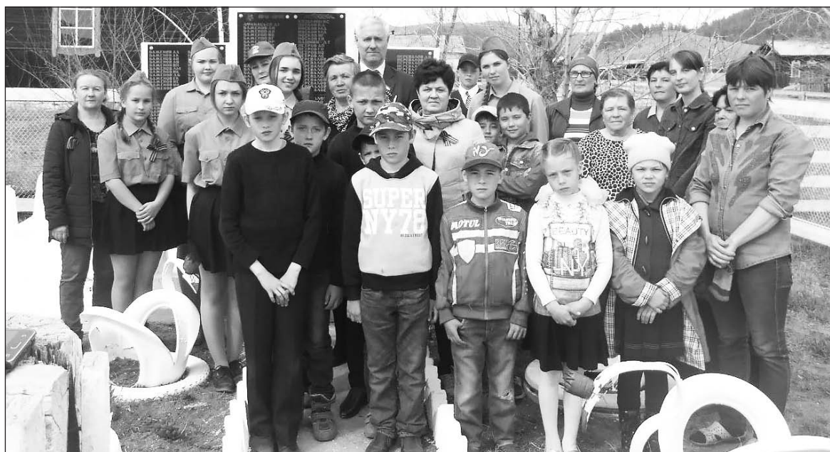
У памятника фронтовикам в Мангиртуе